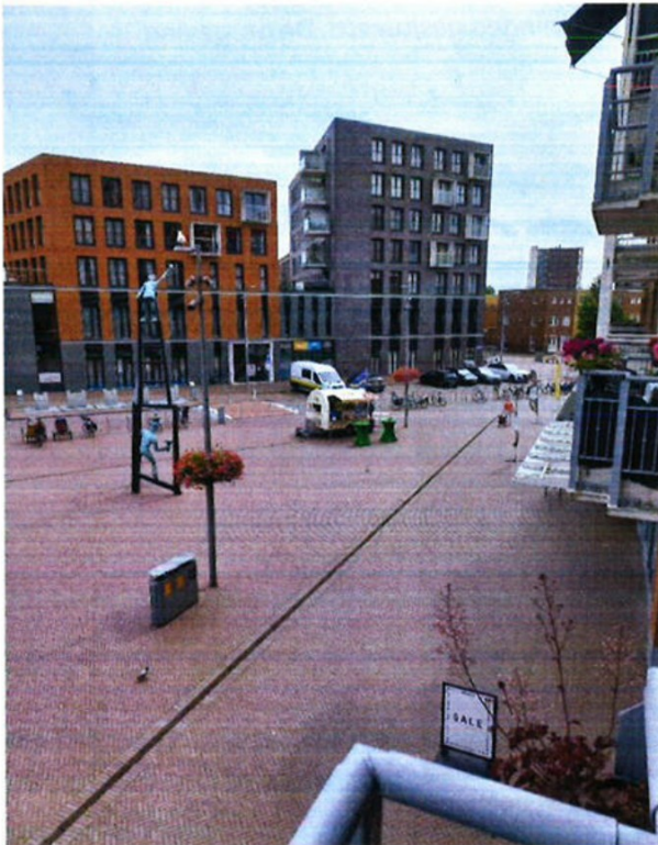
f 2.3 Het zicht vanaf het meetpunt op de foodtruck