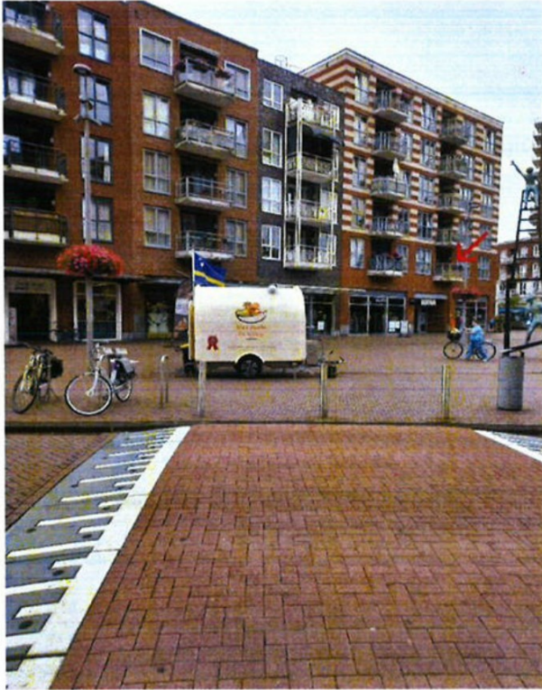
f 2.2 De woningen en het meetpunt ten opzichte van de foodtruck