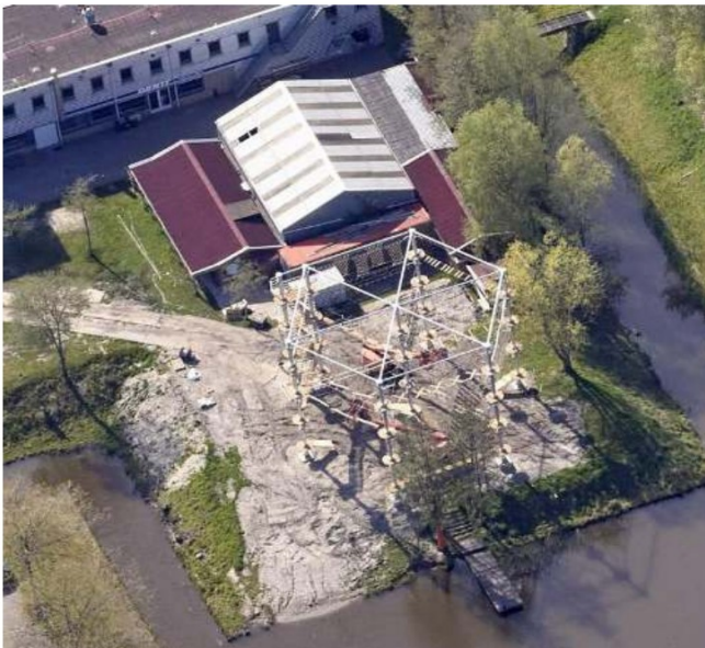
Situatie 2022 met zichtbaar het behoud van de bestaande bomen

Ten zuiden van Adventure Valley/Ayers Rock, aan de overzijde van Buytenparklaan, ligt de nieuwe begraafplaats en het Crematorium Meerbloemhof met ten zuiden hiervan begraafplaats Hoflaan in een groene setting. Door een dichte randbeplanting is het zicht hierop niet mogelijk zowel vanaf de weg als vanuit de begraafplaats richt Adventure Valley/Ayers Rock.