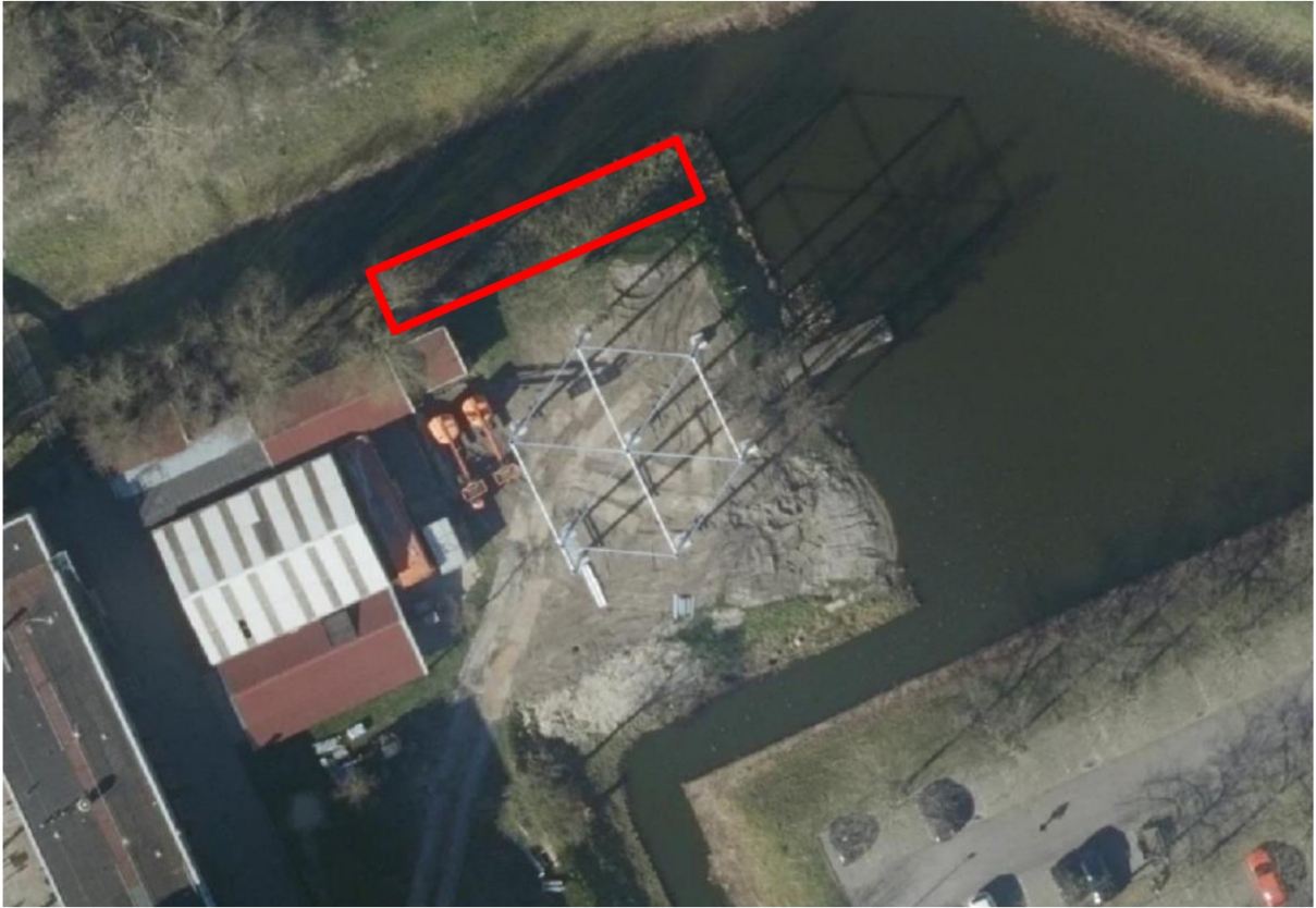
Luchtfoto plangebied met waarop mogelijk ecologische kansen mogelijk zijn.