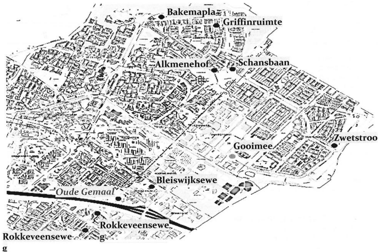
Figuur 3: kaartje Zoetermeer met woonwagenlocaties.