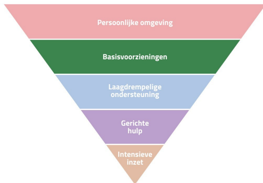
Figuur 4: de laag Basisvoorzieningen van het omgekeerde piramide-model

Deze opgave bevindt zich in de tweede laag van de piramide van het sociaal-maatschappelijk domein: de laag van de basisvoorzieningen. Hier is de gemeente aan zet om een sociale infrastructuur te faciliteren die mensen in staat stelt om mee te doen. Deze laag is breed beschikbaar en richt zich op alle inwoners, zonder dat er sprake hoeft te zijn van een ondersteuningsvraag. Zo biedt de bibliotheek niet alleen boeken, maar ook een plek om te solliciteren of een cursus te volgen. Kunst en cultuur zorgen voor ontspanning en zingeving [29] . Sport en bewegen dragen bij aan vitaliteit en ontmoeten [30] . Goed onderwijs zorgt ervoor dat kinderen en jongeren zich kunnen ontplooiën en hun talenten kunnen ontwikkelen. De openbare ruimte nodigt uit tot contact en deelname, mits deze slim, sociaal en veilig is ingericht [31] [32][33] .