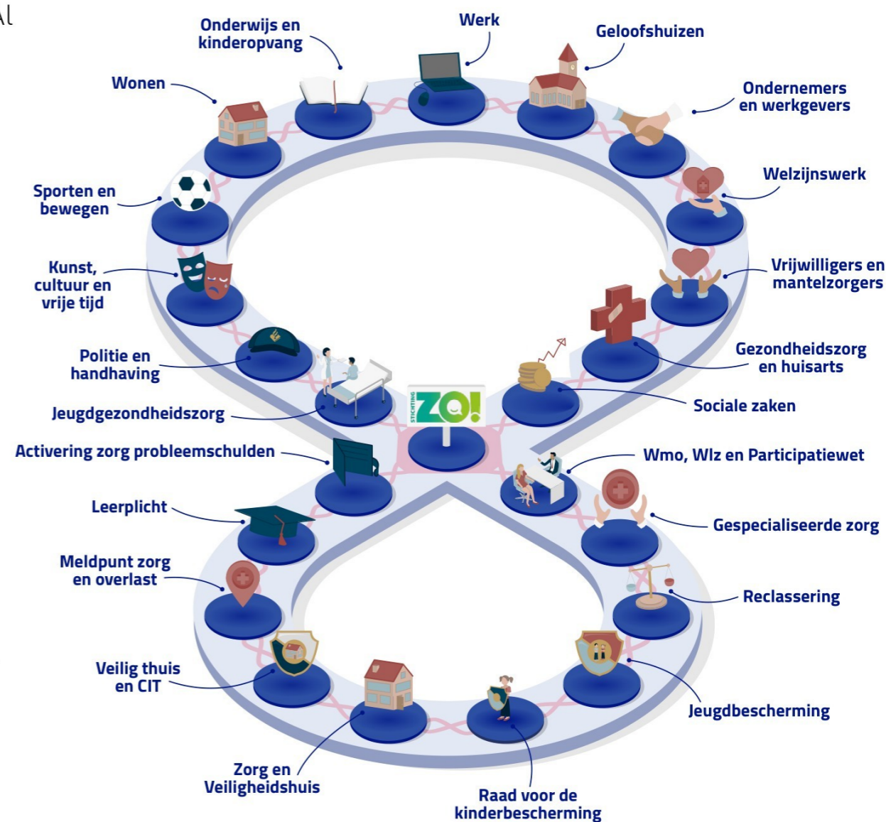
Figuur 1: het Achtje van Zuidplas

Wie ondersteuning nodig heeft, kan hier terecht. Op het gebied van werk, inkomen en schulden werken we bovendien samen met andere gemeentes om een efficiënte toegang te waarborgen.