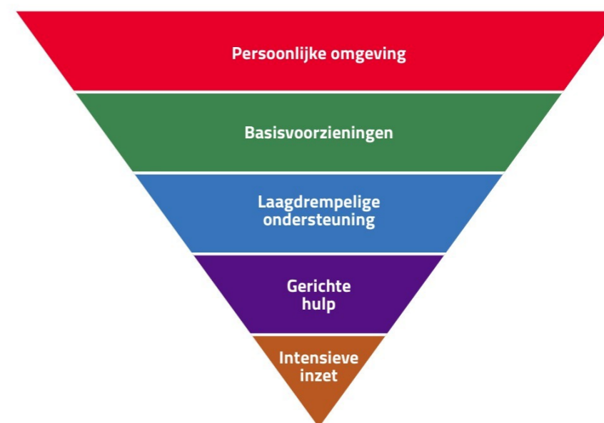
Figuur 2: het omgekeerde piramide-model

De vijf lagen van het sociaal-maatschappelijk domein zijn: