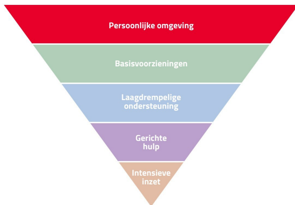
Figuur 3: de laag Persoonlijke omgeving van het omgekeerde piramide-model

De maatschappelijke opgave versterking van de eigen kracht is gericht op de bovenste laag van de piramide van het sociaal-maatschappelijk domein: de laag van de persoonlijke omgeving . Hier draait het om de kracht van de inwoner zelf en diens directe netwerk: familie, vrienden, collega's, burens, vrijwilligers, mantelzorgers, verenigingen, geloofsgemeenschappen en buurtinitiatieven. Als gemeente creëren we de randvoorwaarden die mensen in staat stellen om zelfstandig en samen met anderen vorm te geven aan hun leven. In deze leefomgeving ontstaat de basis voor een veerkrachtige gemeenschap, gedragen door elementen als gezin, werk, wonen, buurtbinding en de onderlinge steun die mensen elkaar bieden in het dagelijks leven.