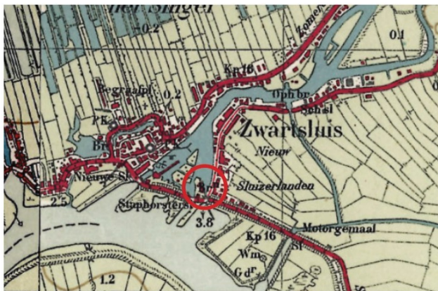
afb. circa 1950