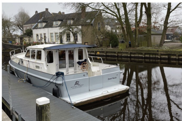
Huidig type vaartuig op de ligplaatsen