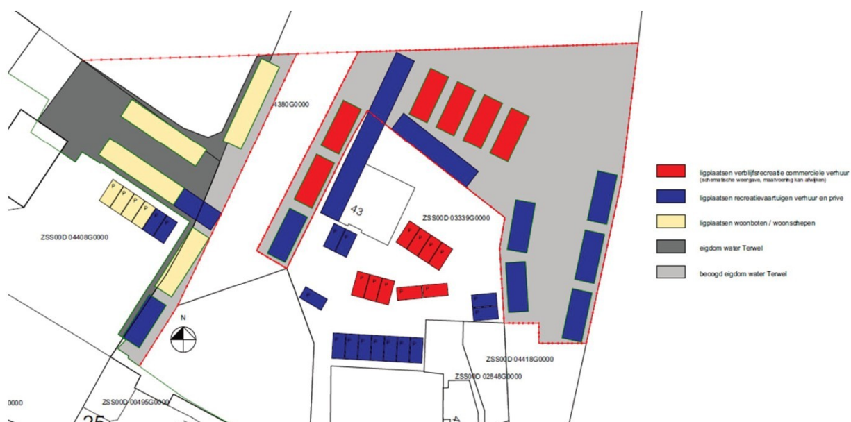
Locatie met in rood de beoogde ligplaatsen voor verblijfsrecreatie

De initiatiefnemer, [REDACTED], is voornemens om bestaande ligplaatsen voor recreatievaartuigen te gebruiken als ligplaatsen voor verblijfsrecreatie. Het gaat in totaal om zes ligplaatsen waar vaartuigen kunnen worden aangelegd en waarbij verblijfsrecreatie op het vaartuig wordt toegestaan. De gemeente Zwartewaterland heeft een vergunningaanvraag ontvangen voor het wijzigen van de functie 'ligplaats recreatievaartuig voor commercieel gebruik' in de functie 'ligplaats verblijfsrecreatie'. Het gaat om de locatie achter Mastenmakersstraat 43 in Zwartsluis. In de aanvraag wordt gevraagd om zes plaatsen die tezamen als het ware een 'watercamping' vormen. De vaartuigen liggen soms om ter plaatse te functioneren (mensen varen er niet mee, maar gebruiken het als vakantiewoning), maar ook zal er geregeld met de vaartuigen worden gevaren (een varende vakantie woning). De gemeente heeft Het Oversticht gevraagd om vanuit stedenbouwkundig oogpunt een advies uit te brengen met betrekking tot de functiewijziging, dan wel randvoorwaarden te verstrekken bij deze functiewijziging.