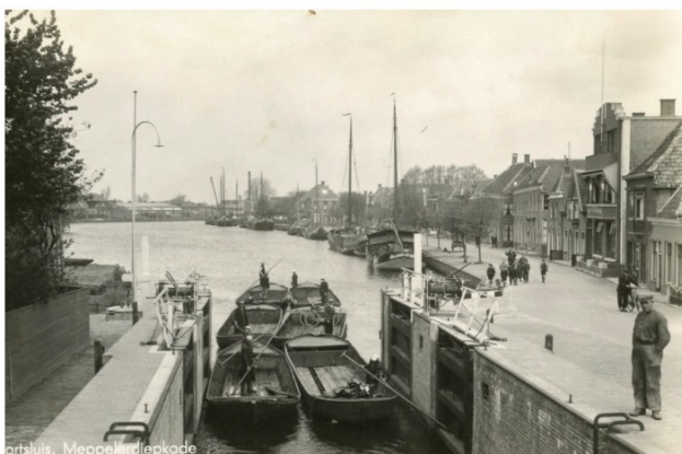
De Staphorsterschutsluis 1948