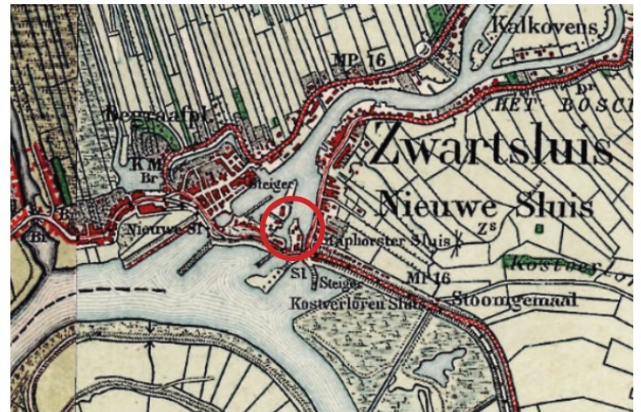
afb. circa 1925