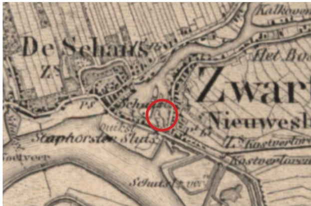
afb. circa 1890