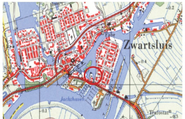
afb. circa 1975