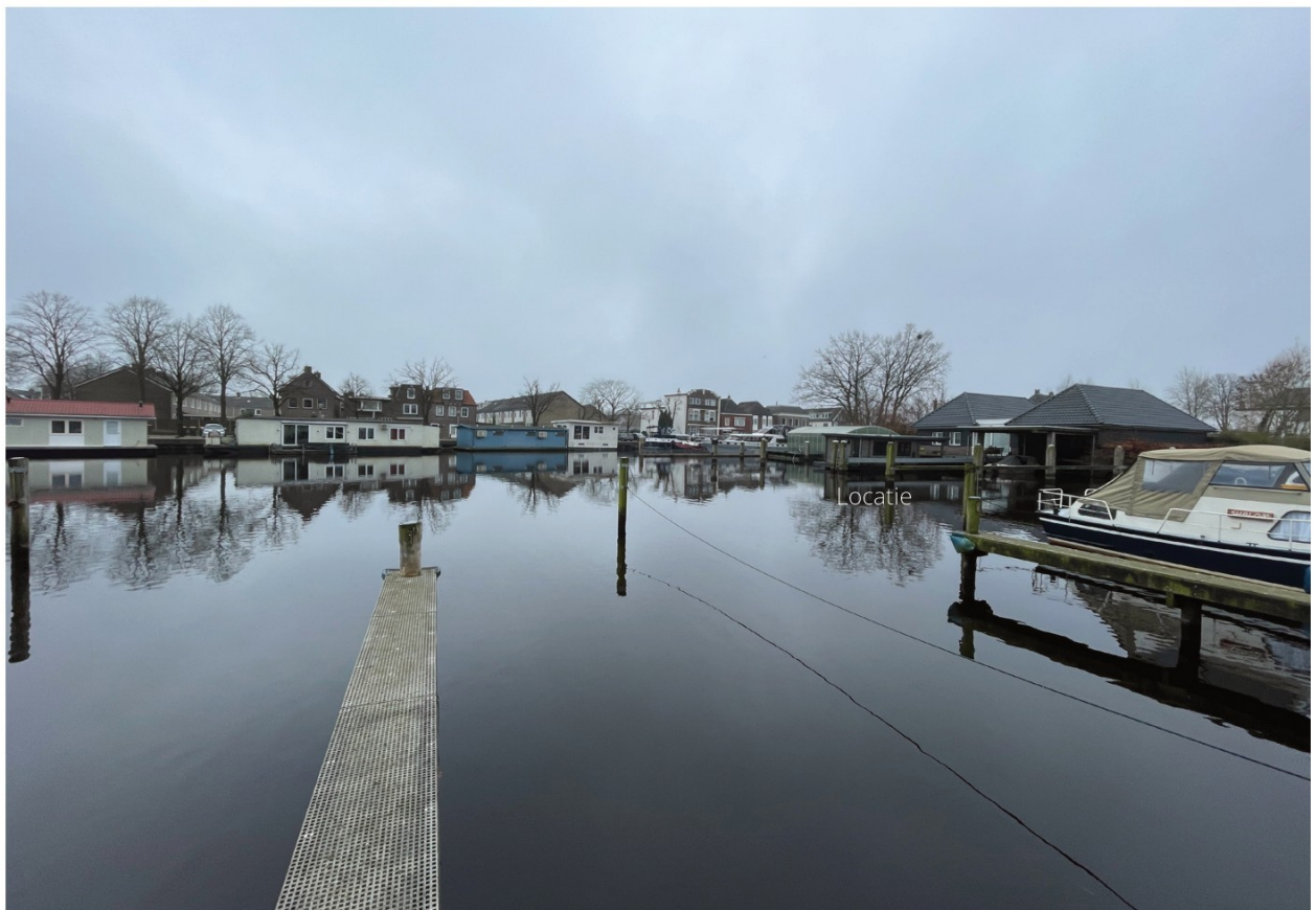
Zicht op de locatie