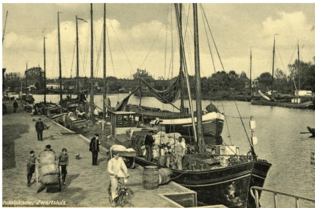
Handelskade ca 1942