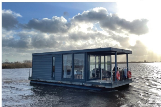
Mogelijk nieuw type vaartuig voor de 6 ligplaatsen (houseboat)