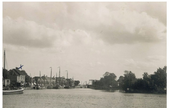
Meppelerdiep, De Nieuwesluis en de locatie