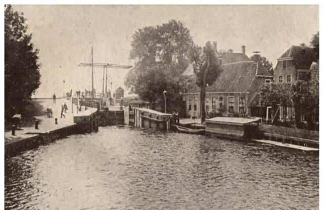
De Staphorsterschutsluis