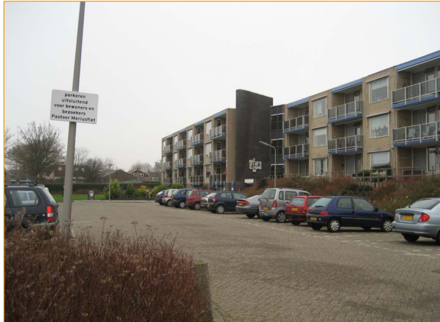
Parkeerterrein Pastoor Meriusflat