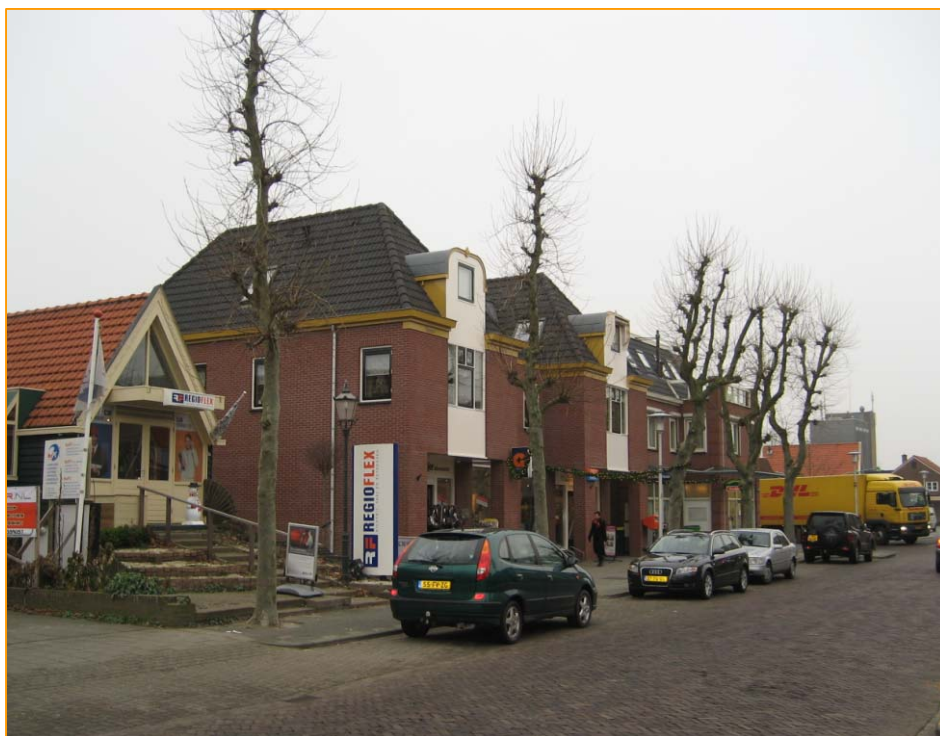
Wuiver - zuid

Indien het bedrijf de beschikking heeft over eigen parkeerplaatsen (zie voor de definiëring hiervan de ontheffingrichtlijnen voor bewoners) wordt het aantal beschikbare parkeerplaatsen in mindering gebracht op het aantal te verstrekken ontheffingen. Per bedrijf wordt, onafhankelijk van het aantal werknemers, maximaal één parkeerontheffing uitgegeven. Ondernemers die zowel voor een bewoners- als voor een bedrijfs-ontheffing in aanmerking komen, komen alleen in aanmerking voor de bewonersontheffing.