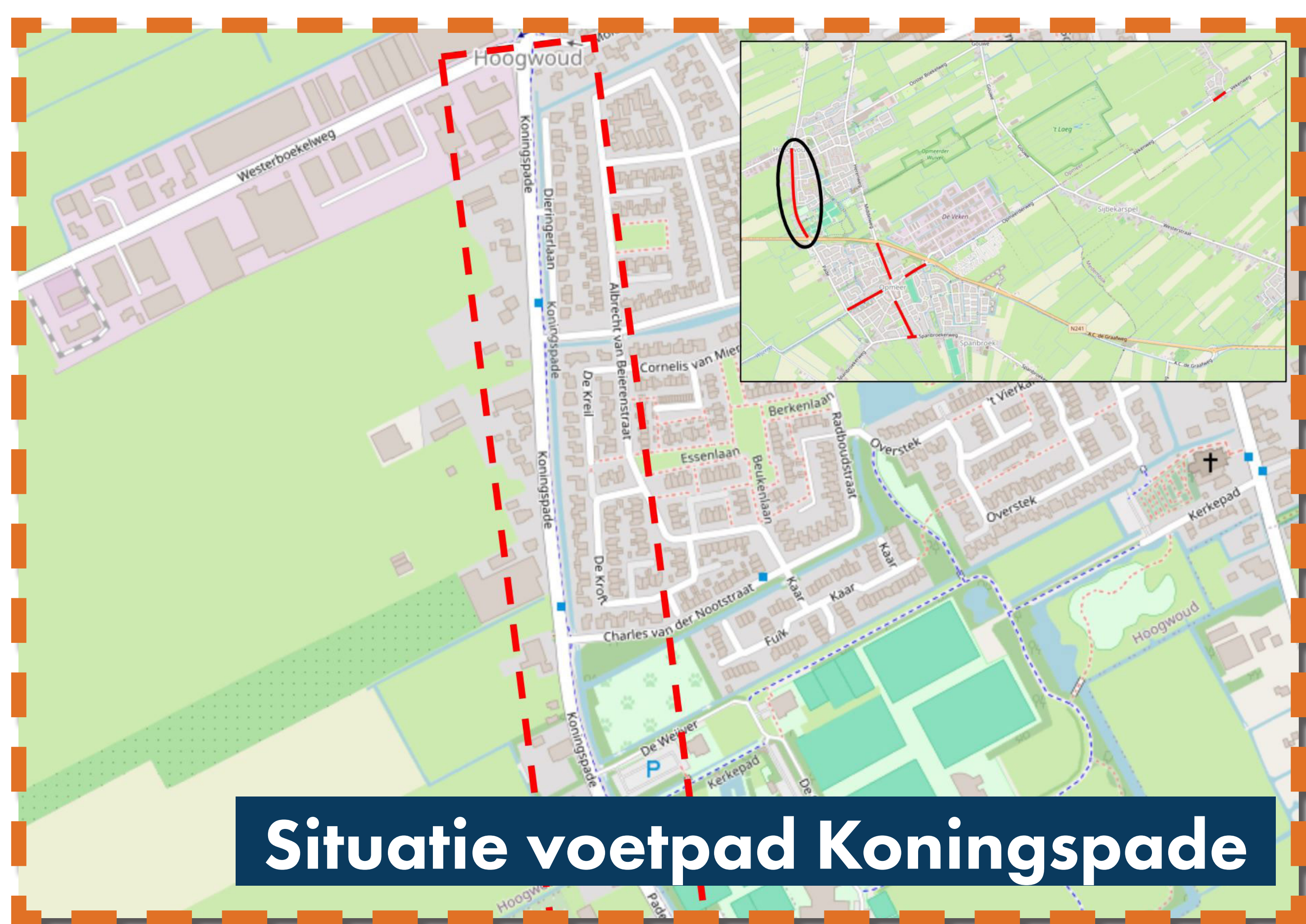
Situatie voetpad Koningspade