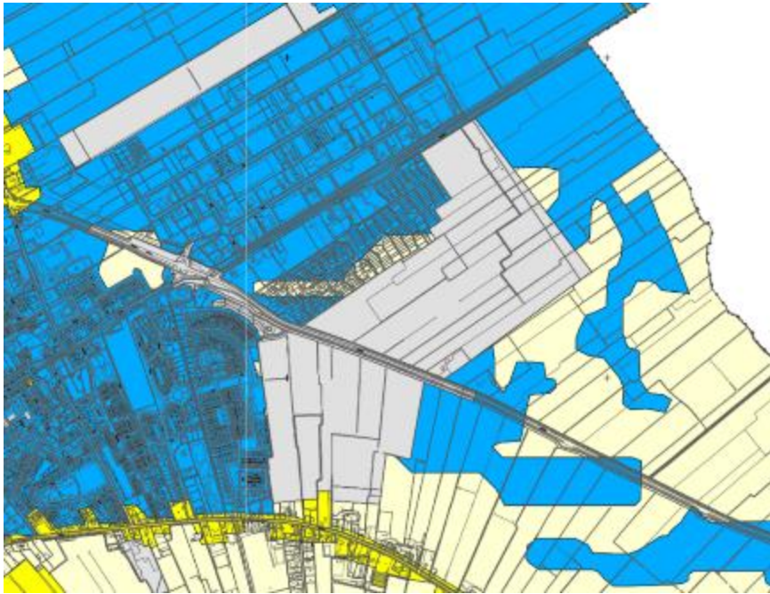
Figuur 4.1: Uitsnede uit de Archeologische beleidskaart van de gemeente Opmeer

historische kaarten en archeologische onderzoeken. Tevens zijn de recent vrijgegeven terreinen afgeschreven. Het grondgebied van onderhavig bestemmingsplan betreft een vrijgegeven gebied.