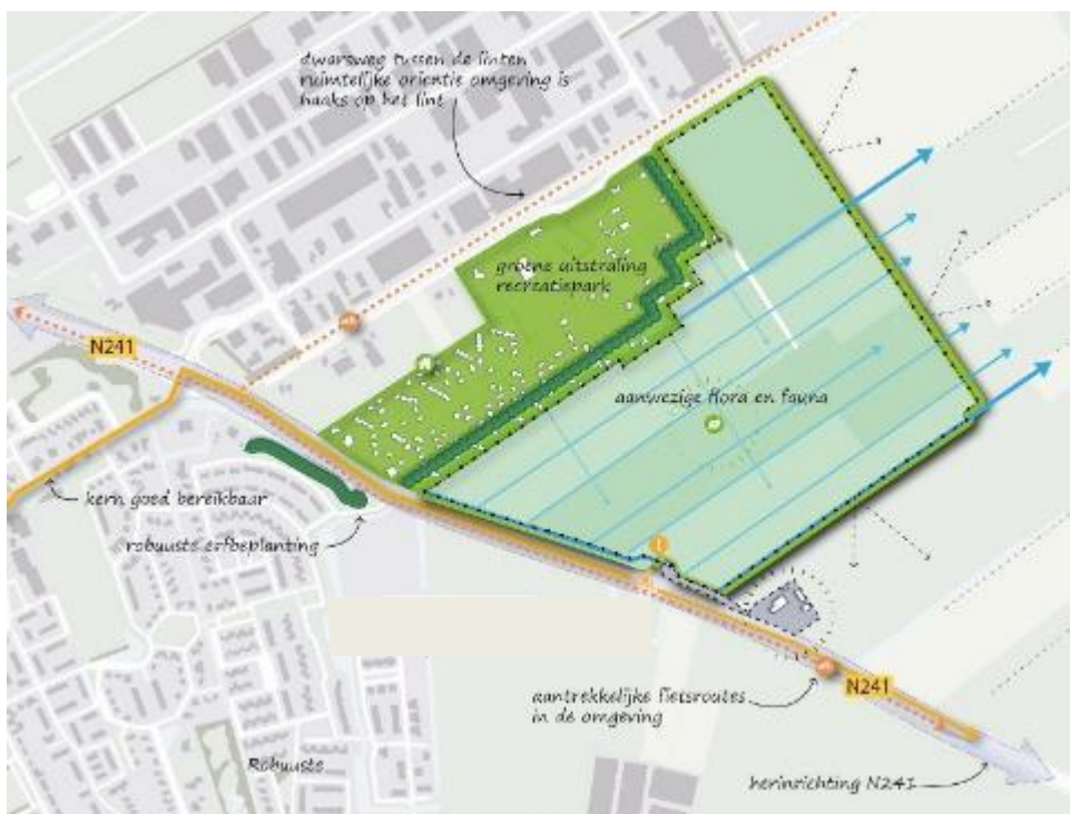
Figuur 3.1 Analyse ruimtelijke structuur