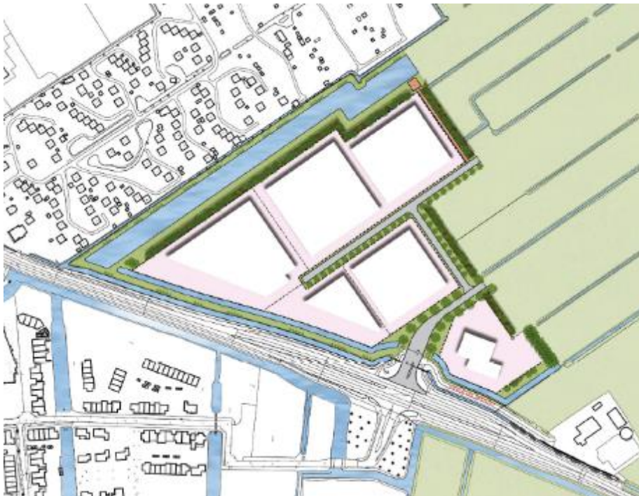
Figuur 2.1: De Veken 4 – mogelijke verkaveling fase 1