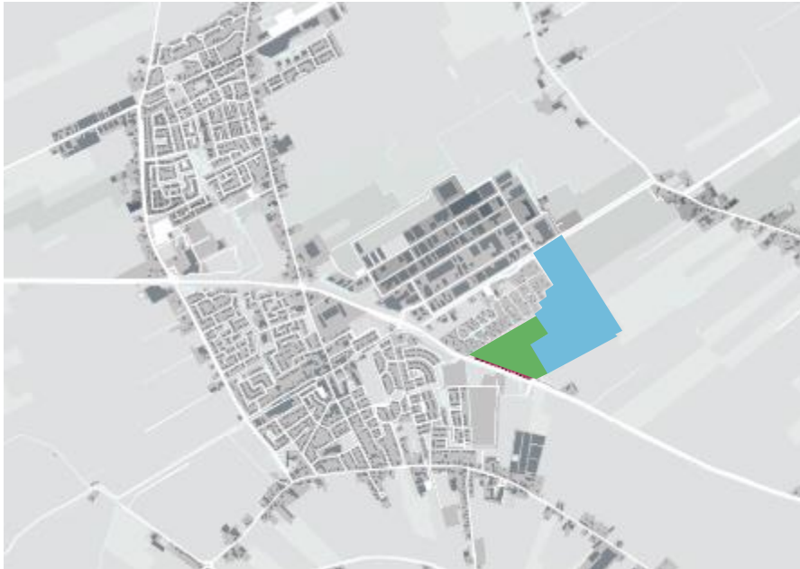
Figuur 1.1: Ligging en globale begrenzing plangebied (in rood de eerste fase)

Bedrijventerrein De Veken 4 vormt de derde uitbreiding van het bedrijventerrein De Veken, dat geheel gelegen is ten noorden van de A.C. de Graafweg. De voorgenomen ontwikkeling vindt plaats net ten noorden van de nieuwe woonuitbreiding Heerenweide. In figuur 1.1 is de ligging van het plangebied in de omgeving weergegeven. Het te ontwikkelen plangebied ligt ten noordoosten van de kern Spanbroek in de gemeente Opmeer. De noordoostelijke begrenzing van het plangebied wordt gevormd door het buitengebied van Opmeer en Medemblik. Enkele agrarische percelen vormen aldaar de grens. De zuidelijke grens wordt bepaald door de A.C. de Graafweg (N241) en agrarische percelen. Het recreatiepark West-Friesland vormt tenslotte de noordwestelijke begrenzing.