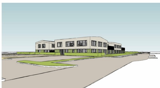
Impressie vanuit de Wuiver