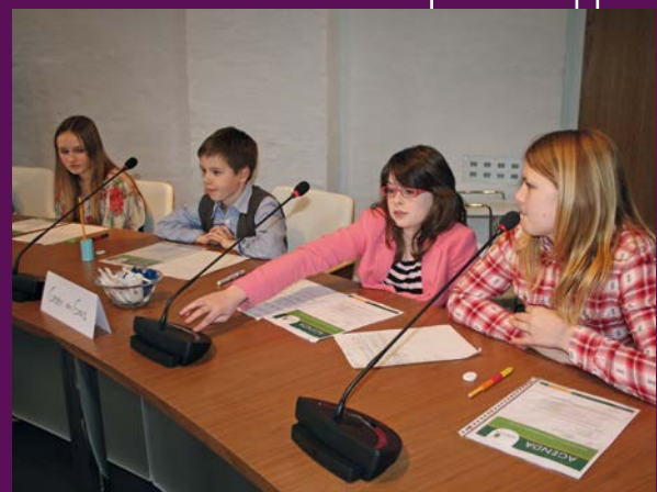
Jeugdraad in raadszaal

De gemeente wordt steeds meer onderdeel van een netwerk van mensen en organisaties