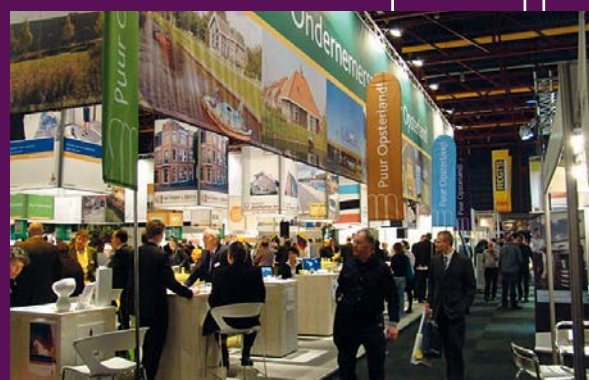
Beurs met Opsterlandse ondernemers

Opvallend is de toename van het aantal bedrijfsvestigingen tegenover een afname van de totale werkgelegenheid. Dit komt door een toenemend aantal zzp'ers en bedrijven die steeds minder personeel in dienst hebben. Deze trend zal zich verder voortzetten. Het aantal vacatures nam de afgelopen jaren sterk af en ook de werkloosheid loopt op in overeenstemming met de landelijke trend. Overigens kent onze gemeente wel een relatief laag aantal bijstandsgerechtigden. Door de veelzijdigheid van het werkaanbod is de lokale economie minder kwetsbaar dan bij eenzijdige samenstelling.