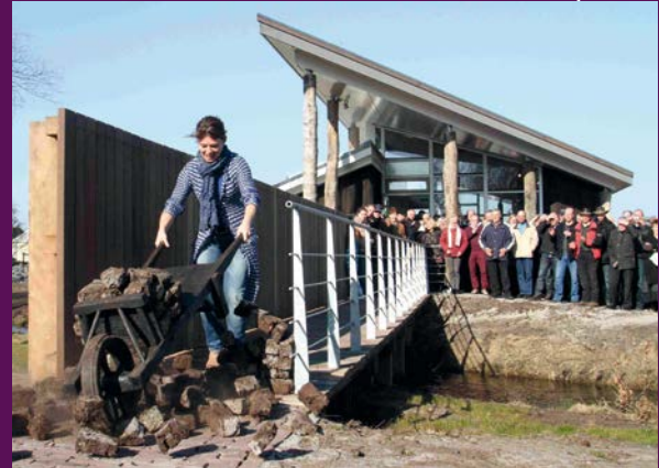
Nieuwe ontvangstruimte It Damshûs Nij Beets