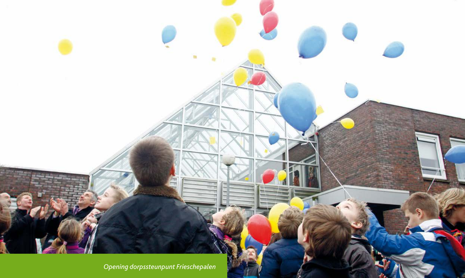
Opening dorpssteunpunt Frieschepalen

Van medewerkers wordt verwacht dat zij dienstverlenend zijn richting de burger. Zij moeten vraaggericht maatwerk kunnen leveren. Medewerkers moeten een groot inlevend-, meedenkend-, creatief probleemoplossend- en verbindend vermogen hebben en tegelijkertijd resultaatgericht zijn. Dat stelt eisen aan hun competenties, maar ook aan de ruimte en het vertrouwen die zij krijgen van bestuur en management. We investeren dan ook in opleiding, competenties, houding en gedrag van medewerkers en management. Centrale kernkwaliteiten zijn: professioneel, betrouwbaar, gedreven, inspirerend en open voor ideeën en opvattingen van anderen.