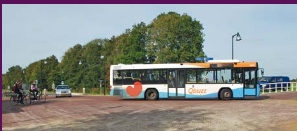
Shared space plein Siegerswoude

Gelet op de leefbaarheid en vitaliteit van het platteland is het openbaar vervoer een belangrijke voorziening voor onze inwoners. De vergrijzing van de bevolking zal onder meer de vraag naar openbaar vervoer vergroten. Wij zoeken voortdurend naar maatwerk om het aanbod betaalbaar te houden en aan te laten sluiten op de vraag.