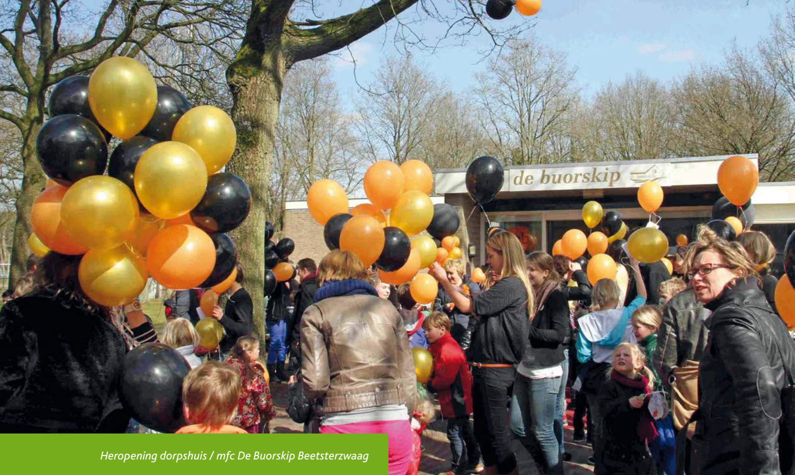
Heropening dorps huis / mfc De Buorskip Beetsterzwaag

Voor de leefbaarheid in de kleinere dorpen willen wij vooral blijven inzetten op het handhaven van de kwaliteit van de woon- en leefomgeving en het stimuleren van de sociale samenhang. Dat betekent niet dat in de kleinere dorpen andere voorzieningen moeten verdwijnen. Er wordt rekening gehouden met de specifieke omstandigheden en mogelijkheden van ieder dorp.