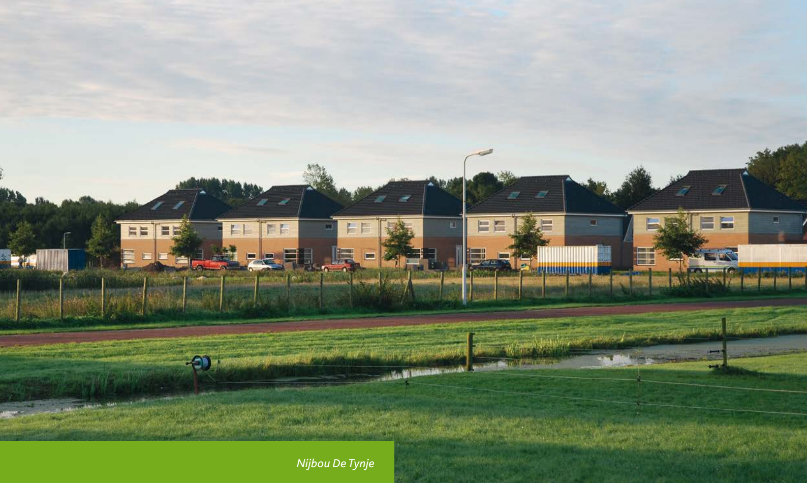
Nijbou De Tynje