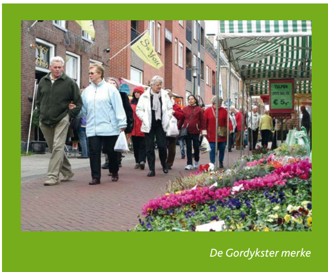
De Gordykster merke

Troch it feroarjen yn it oanbod fan de soarch foar de langere termyn sille minsken langer selsstandich wenjen bliuwe en minder profesjonele stipe krije. Minsken dy't help nedich hawwe sille (noch) faker as foarhinne in berop dwaan moatte op it eigen netwurk (mantelsoarch) of helpen wurde troch in frijwilliger. Hoe fansels it ek klinkt, de eigen krêft fan boargers wurdt wer belangryk. Dêr wêr de fersoargingssteat in oantal desennia fan 'e widze oan it grêf oan minsken soarch en stipe levere, krije wy de kommende jierren te meitsjen mei in oerheid dy't har werom lûkt. De ferantwurdlikens foar de gemeente is de kommende jierren rjochte op dy groep ynwenners, dy't help (écht) nedich hat om selsstannich te wenjen en mei te dwaan oan de maatskippij en op gjin inkelde wize weromfalle kin op de eigen krêft of it eigen netwurk.