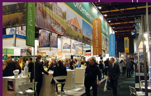
Beurs mei Opsterlânske ûndernimmers

Wat opfalt is it tanimmen fan it oantal bedriuwefestigingen tsjinoer in ôfname fan de totale wurkgelegenheid. Dit komt troch in tanimmend oantal 'zjp'ers' en bedriuwen dy't hieltyd minder persoanen yn tsjinst hawwe. Dy trend sil fierder trochsette. It oantal fakatueres is de ôfrûne jierren sterk ôfnommen en ek de wurkleazens rint op yn oerienstimming mei de lanlike trend. Fierders hat ús gemeente wol in relatyf leech oantal minsken yn de bystân. Troch it brede oanbod fan wurk is de lokale ekonomy minder kwetsber as by in iensidige gearstalling.