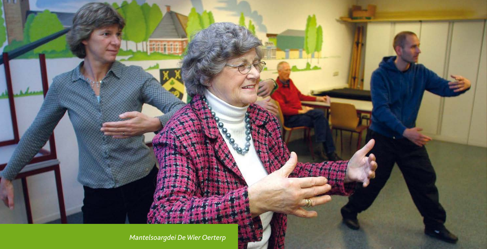
Mantelsoargdei De Wier Oerterp

In belangryk ûnderwerp is de brede skoalle. Hjirmei wurdt in goede gearwurking bedoeld tusken alle partijen dy't har dwaande hâlde mei opgroeïende bern. It doel is om de ûntwikkelingen fan jeugdigen sûnder al te folle problemen en it leafst sûnder ûnderbrekking ferrinne te litten. It giet dêrby net allinne om de húsfersting fan de gearwurkjende foarsjenningen, mar ek en benammen om de kwaliteit en it ôfstimmen fan dy foarsjenningen. De gearwurking en gearhing tusken alle ferskillende aktiviteiten en tsjinsten dy't de oerheid te bieden hat is betiden lestich te oersjen, lit stean dat dit yn alle opsichten effisjint ferrint. De taak fan de gemeente is om te soargjen foar it ôfstimmen en it gearwurkjen yn de helpbiedende taken en tsjinsten. It Sintrum foar Jeugd en Gesin spilet dêrby in krusiale rol. Yn it sintrum wurkje ferskillende partijen gear om de jongerein fan 0 - 3 jier en har âlders te stypjen om ûntwikkelkânsen optimaal te benutten en mooglike problemen by it grutwurden of it opfieden yn in yntiids stadium oan te pakken.