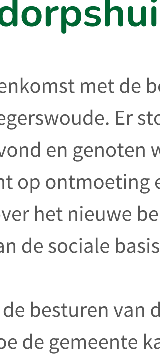
Koffieapp De Doarpsûs