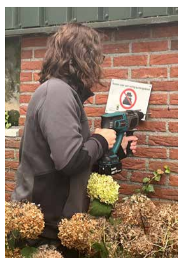
Handhaver bevestigt bordje op de muur.