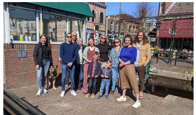
De toekomstige bewoners van de tiny houses hebben op een mooie dag in maart met elkaar kennisgemaakt in Gorredijk.

Er zijn weer een paar kavels vrijgekomen. Geïnteresseerden kunnen zich via tinyhouseopsterland@gmail.com aanmelden voor de nieuwsbrief met de laatste informatie. Hierin staat ook een link naar het inschrijfformulier. Reageren op de kavels kan tot en met zondag 1 mei 2022. Aanmeldingen die na deze datum binnenkomen, worden op de reservelijst geplaatst.