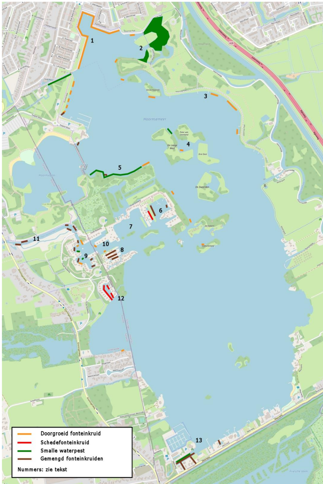
Afbeelding 1. Gecombineerde vegetatiekaart op basis van aangetroffen begroeiing bij inspectieronde (10 juni) en karteringsronde (22 augustus)