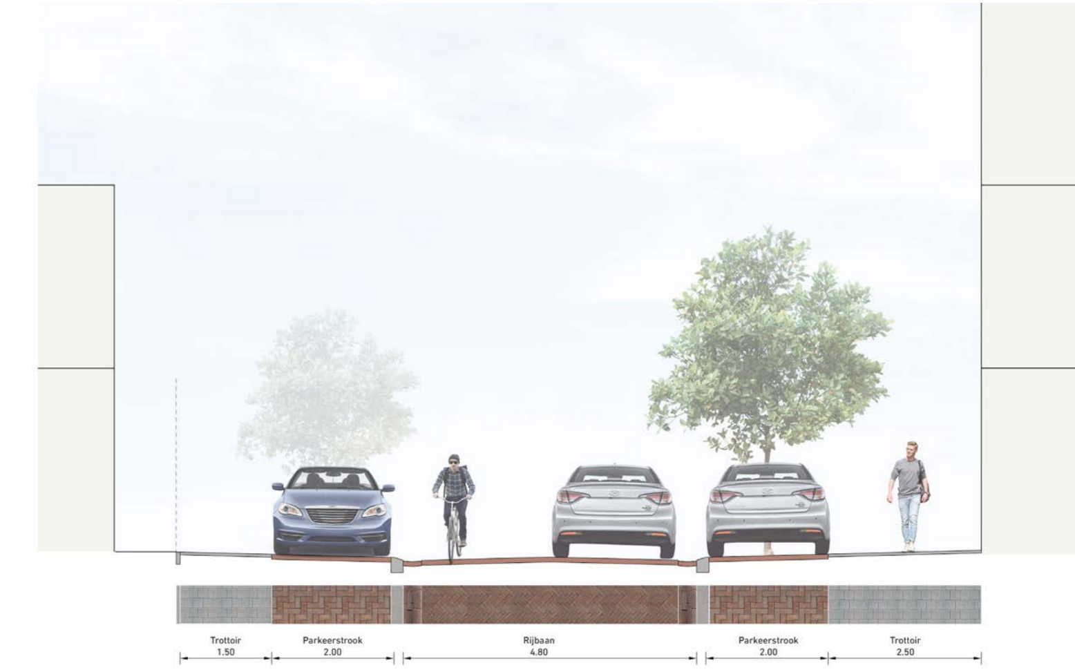
PROFIEL D-D HOGEWEG