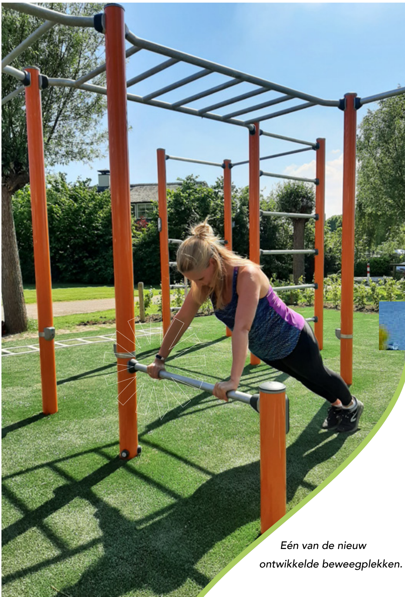
Eén van de nieuw ontwikkelde beweegplekken.