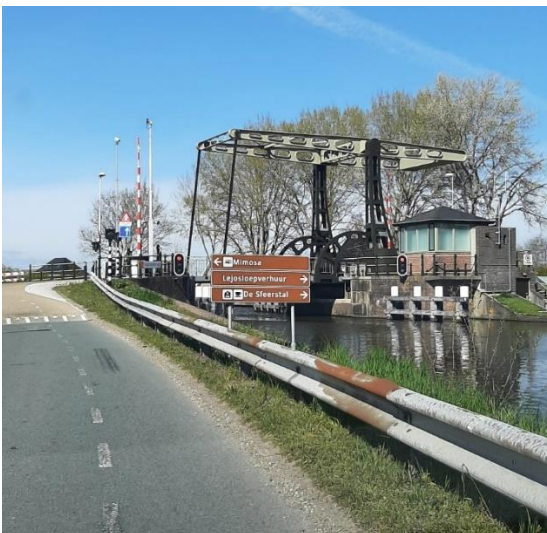
Afbeelding 2. Voorbeeld objectbewegwijzering naar recreatieve voorzieningen