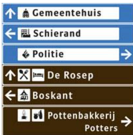
Figuur 1: voorbeeld bewegwijzering

De borden met verwijzingen naar maatschappelijke voorzieningen en bestemmingen zien er anders uit dan de borden met verwijzingen naar recreatieve voorzieningen en bestemmingen. In hoofdstuk 4 worden de inhoudelijke verschillen tussen deze categorieën toegelicht. Voor beide categorieën is gekozen voor een strokenbord. Hierbij wordt elke bestemming of voorziening, met bijbehorend symbool en richtingspijl, vermeld op een afzonderlijke strook. De uiteindelijke wegwijzer wordt samengesteld door een reeks stroken te stapelen. Daarbij worden de stroken gegroepeerd naar categorie en richting. Dit levert voor de weggebruiker het meest overzichtelijke beeld op. Onderstaand een voorbeeld hiervan.