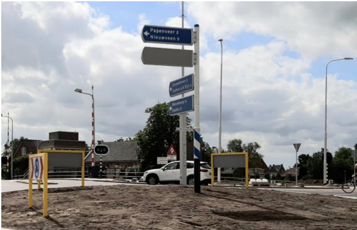
Afbeelding 1. Voorbeeld NBd-bewegwijzering