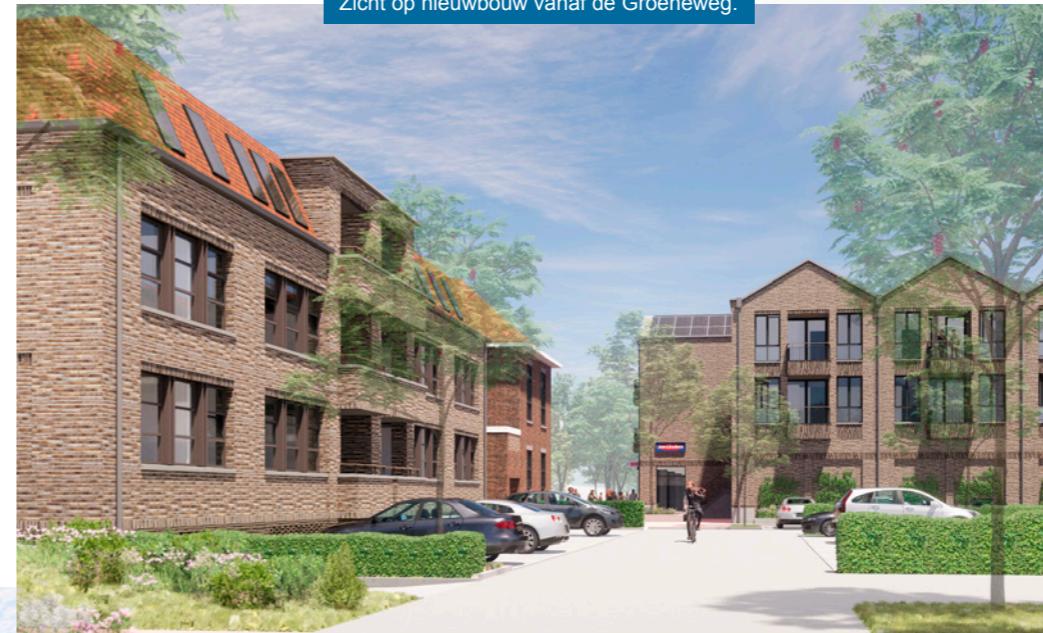
Zicht op nieuwbouw vanaf de Groeneweg.

Het appartementengebouw aan de rotonde, dat aansluit op de Sint Jozef-school, is ook gewijzigd. Het gebouw schuift op naar de Jozefschool, waardoor er meer ruimte is voor groen aan de Groeneweg en rondom het appartementengebouw zelf. De halfverdiepte parkeergarage onder het gebouw is geoptimaliseerd. Ook het parkeerhof aan de Groeneweg is verder uitgewerkt en krijgt een groen karakter dat past in het straatbeeld. Voor het dak is gekozen voor een kleur die aansluit bij de Sint Jozef-school. Op onze website is een 3D video van het aangepaste ontwerp te bekijken!