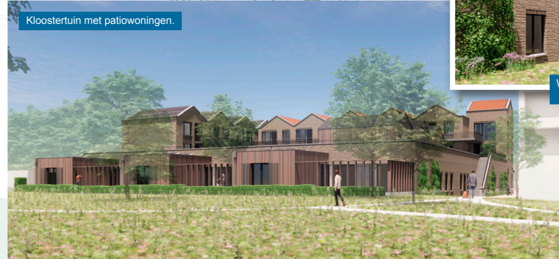
Wandelroute tussen woongebouw De Ark en nieuwbouw.

Op 7 juni is het ontwerp voor de nieuwe Kei gepresenteerd aan de huidige en toekomstige gebruikers. We willen omwonenden en andere geïnteresseerden natuurlijk ook informeren over de ontwikkelingen. Het projectteam nodigt je daarom uit voor de informatiebijeenkomst op 11 juli in de huidige Kei. De bijeenkomst start om 19.00 uur. Neem voor vragen of meer informatie contact op via dekei@reuseldemierden.nl .