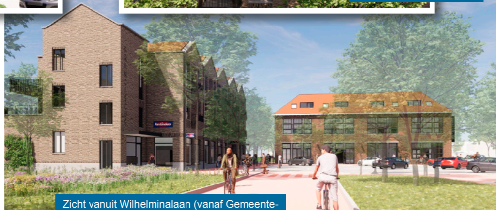
Zicht vanuit Wilhelminalaan (vanaf Gemeentehuis) richting Sint Jozefschool.