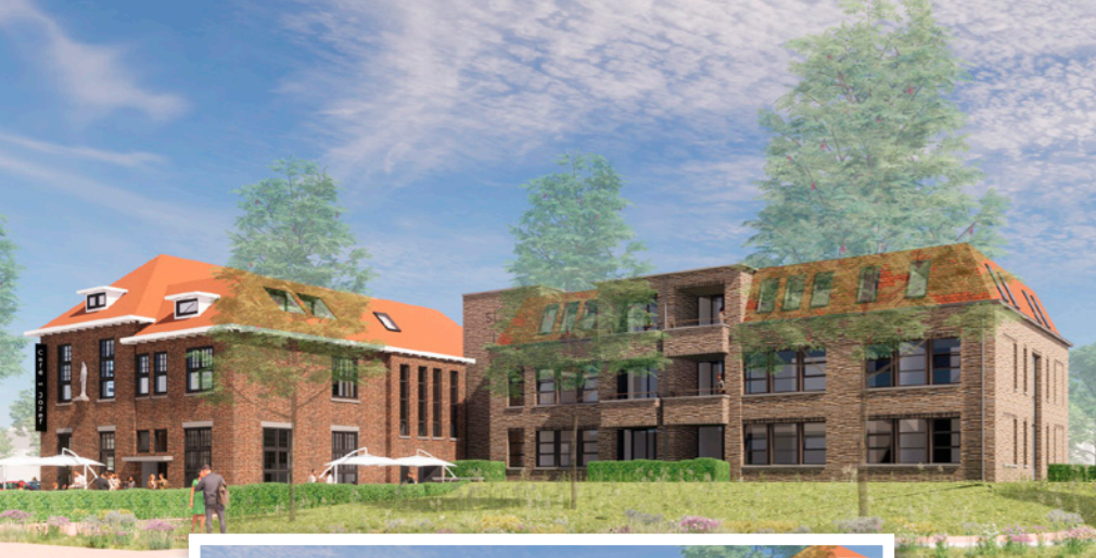
Zicht vanaf Marktpllein op nieuwbouw.