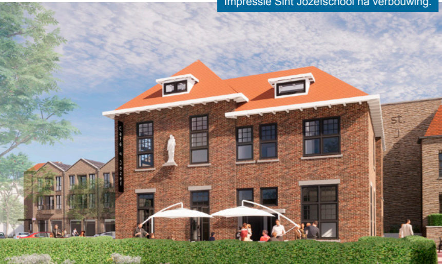
Impressie Sint Jozefschool na verbouwing.