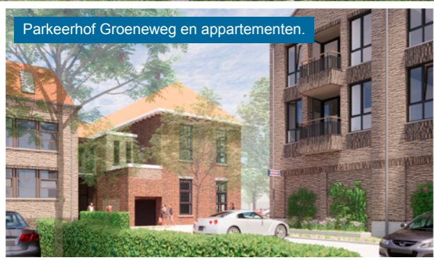
Parkeerhof Groeneweg en appartementen.