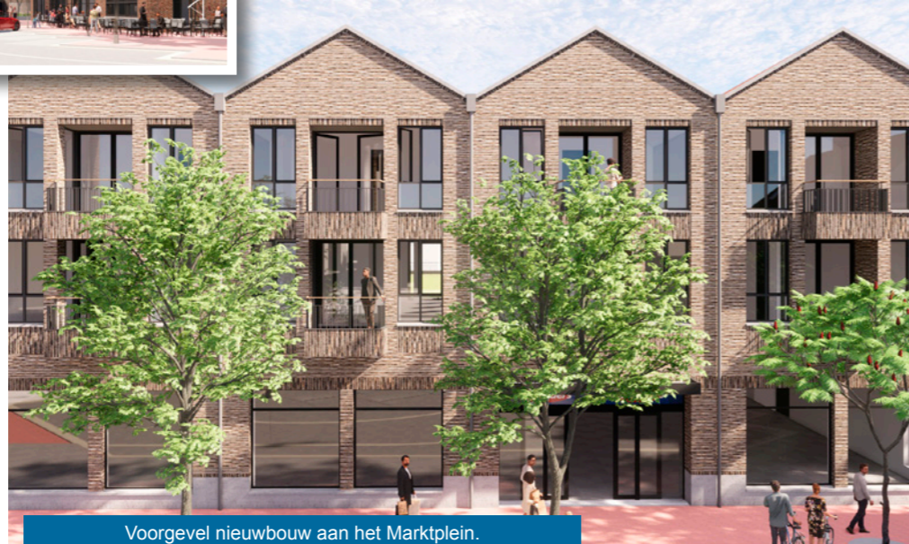
Voorgevel nieuwbouw aan het Marktpllein. Op de begane grond supermarkt en daarboven appartementen.

Cultureel Centrum De Kei wordt gesloopt. Op dezelfde locatie wordt de multifunctionele accommodatie (MFA) De Kei gebouwd. Een werkgroep van gebruikers heeft samen met de architect en projectbegeleiding afgelopen maanden gewerkt aan een nieuw ontwerp. Het gebouw wordt uitnodigend en multifunctioneel. MFA De Kei wordt een aantrekkelijk gebouw, een 'tweede huiskamer' en een mooie toevoeging aan het nieuwe Kerkplein. Het projectteam heeft in overleg met de gebruikers en de gemeente besloten om De Kei nu nog niet te slopen, minimaal tot het moment dat er zekerheid is over contractafspraken met de aannemers. Daarna verhuizen de gebruikers (grotendeels) tijdelijk naar het gemeentehuis. Op de foto een eerste impressie.