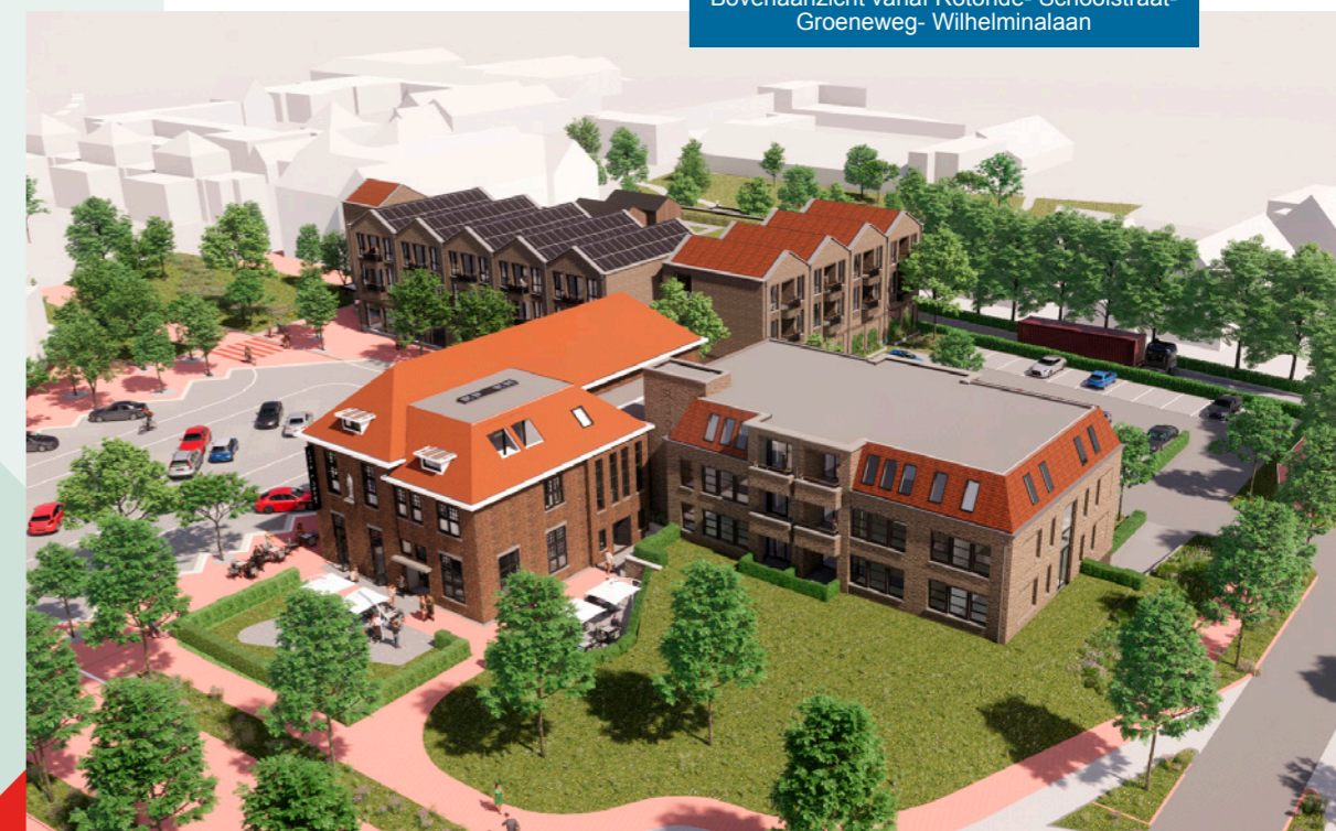
Bovenaanzicht vanaf Rotonde- Schoolstraat- Groeneweg- Wilhelminalaan

Het ontwerp van de nieuwbouw van de supermarkt met appartementen, de appartementen aan de Groeneweg en de verbouw van de Sint Jozefschool is gewijzigd ten opzichte van het voorlopige ontwerp, dat we eerder presenteerden. Zo is de gevel van de supermarkt verder gedetailleerd en verfraaid en is gekozen voor een donkere baksteen. Het gebouw krijgt een natuursteen plint en er zijn meer elementen, ramen en groen toegevoegd. Het dak krijgt dakpannen in dezelfde kleur als de Sint Jozefschool.