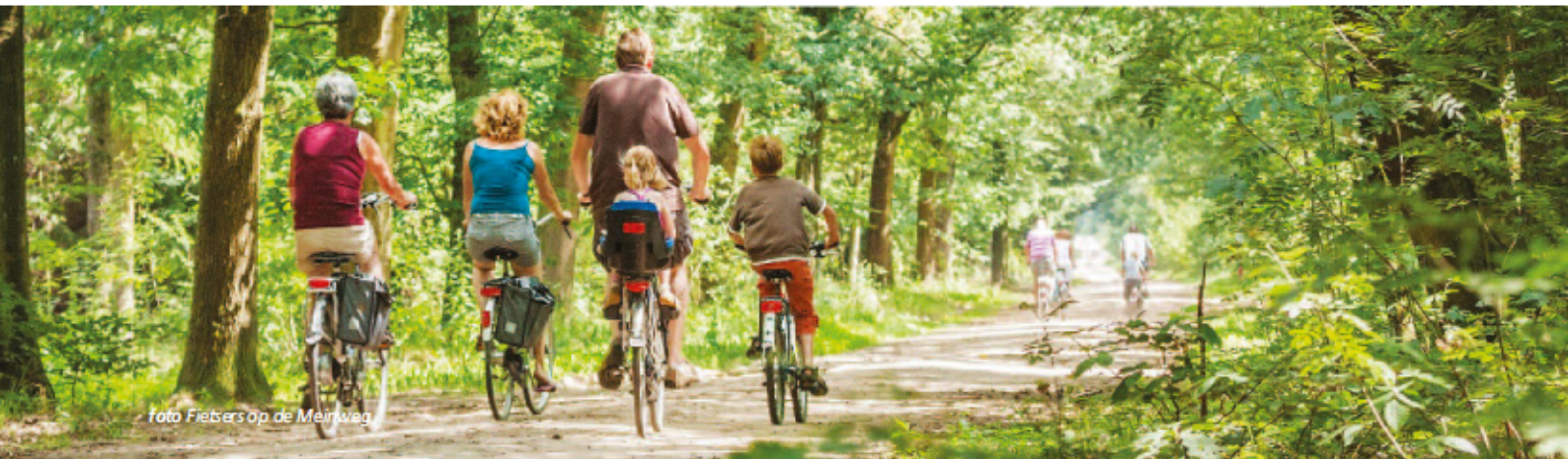
foto Fiebers op de Meinweg