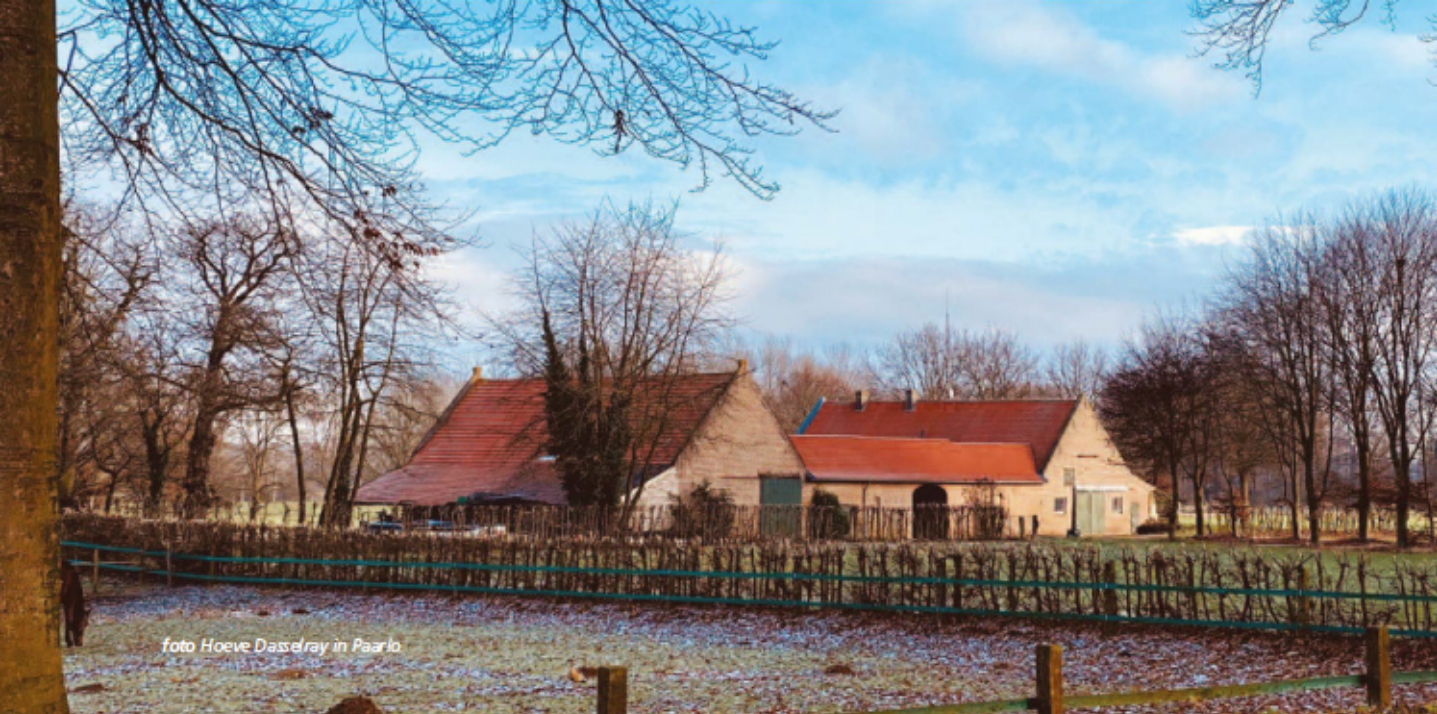
foto Hoeve Dasselray in Paarlo

Dit speelt op alle beleidsterreinen, zowel sociaal als ruimtelijk. Voorbeelden zijn de opschaling van regionale samenwerkingen jeugdzorg en landelijk wordt steeds meer rechtstreeks ingegrepen op zowel het provinciale, regionale alsook het lokale woonbeleid. Het kabinet zet in op sterke regio's aan de landsgrens door interbestuurlijk te werken aan de (gebieds)opgaven in deze regio's. En door het versterken van de grensoverschrijdende samenwerking met grensregio's in onze buurlanden.