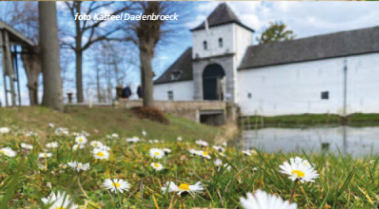
foto Kasteel Daalenbroeck