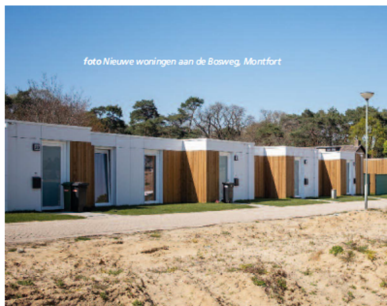
foto Nieuwe woningen aan de Bosweg, Montfort

Daarnaast investeren we in de samenwerking met de woningcorporatie(s) en de huurdersbelangenvereniging.