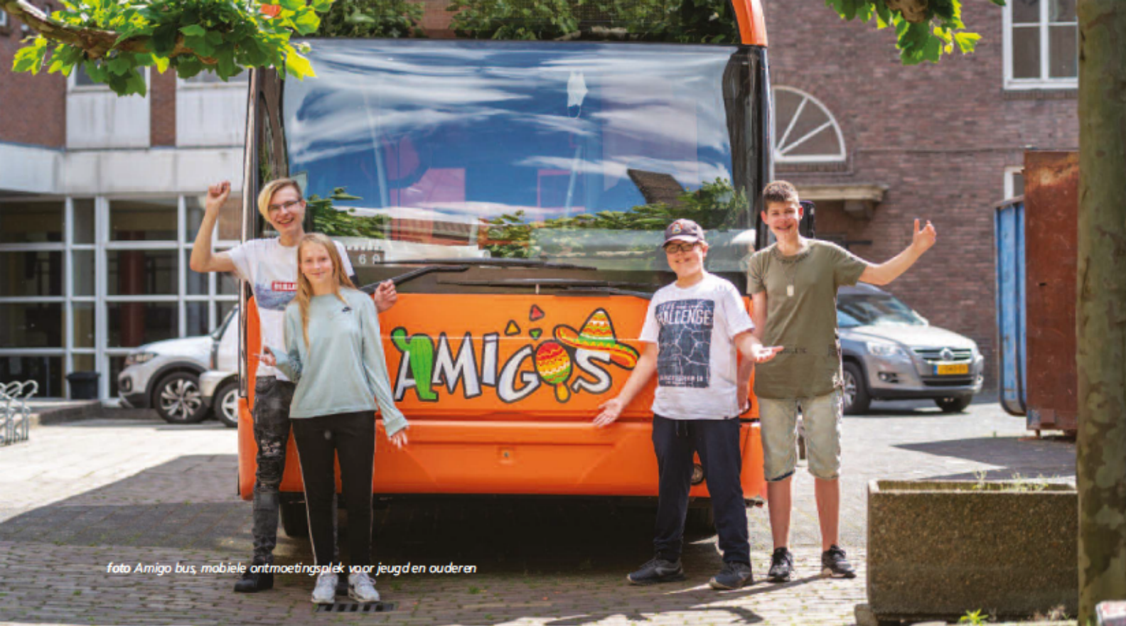
foto Amigo bus, mobiele ontmoetingsplek voor jeugd en ouderen

onder andere bij de huisarts ( praktijkondersteuner jeugd-GGZ ), vanuit het sociaal team en de school ( gedragsdeskundige ). Daarnaast is er specifieke inzet op armoede en financiële problematiek . Vanaf 2023 maken we de omslag van het proefdraaien met pilots naar het structureel invoeren in de praktijk. We doen dit samen met professionals, vrijwilligers en ervaringsdeskundigen. Het principe van positieve gezondheid blijft leidend. Zo ontstaat een stevige basis met het sociaal team in een sleutelpositie en zijn we minder afhankelijk van het regionaal ingekochte gespecialiseerd hulpaanbod.