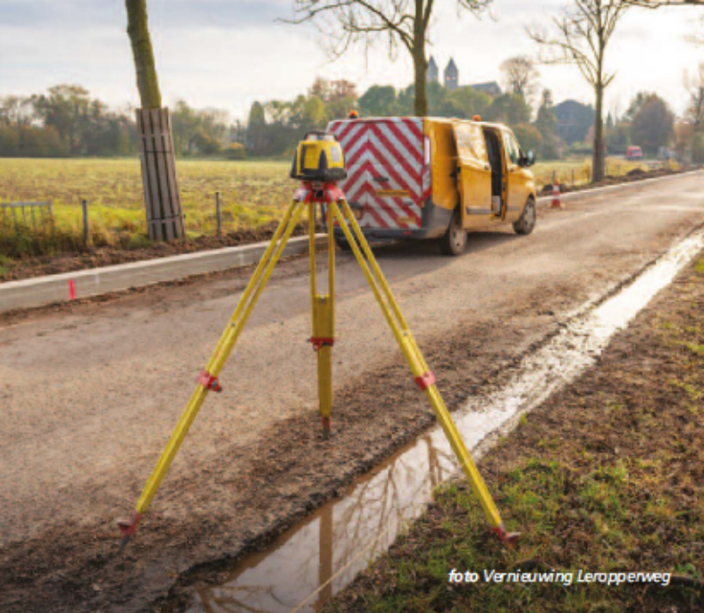
foto Vernieuwing Leroppenweg