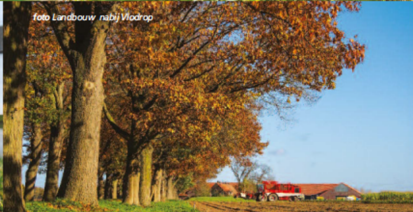
foto Landbouw nabij Vlodrop

Uit landelijk onderzoek blijkt dat de economische waarde van natuurrecreatie en-toerisme gestaag toe neemt. Bij de ontwikkeling van natuur in onze gemeente zijn we voortdurend op zoek naar een goede balans tussen de natuurwaarden en de economische kansen. Hiervoor willen we in 2023 concrete resultaten boeken in de omvorming van het Nationaal Park Meinweg naar een NP Nieuwe Stijl.