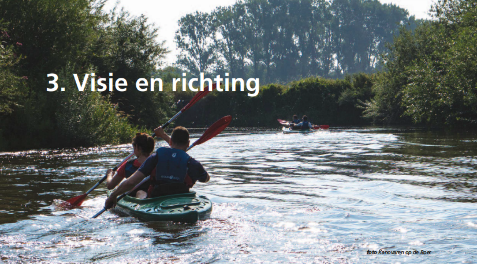
foto Kanovaren op de Roer

Wij geloven in de kracht van mensen, individueel en collectief. Mensen vormen samen de gemeenschap van Roerdalen. In dorpen en buurten, jong en oud, via betaald werk, als mantelzorger, vrijwilliger of als ondernemer. Wij geloven in een samenleving waarin iedereen zoveel mogelijk meedoet. Want in vitale dorpen nemen mensen initiatief en verantwoordelijkheid voor hun buurt en hun buurtbewoners. Hierin is de afgelopen jaren al veel bereikt. Dit bouwen we verder uit, naar meer mensen en meer resultaten. Inwoners moeten gewoon makkelijk mee kunnen doen. Zo dragen we samen bij aan geluk en levensvoldoening van alle mensen in Roerdalen. Onze kernwaarden respect en gelijkwaardigheid, vertrouwen en verantwoordelijkheid zijn bepalend voor onze manier van werken.