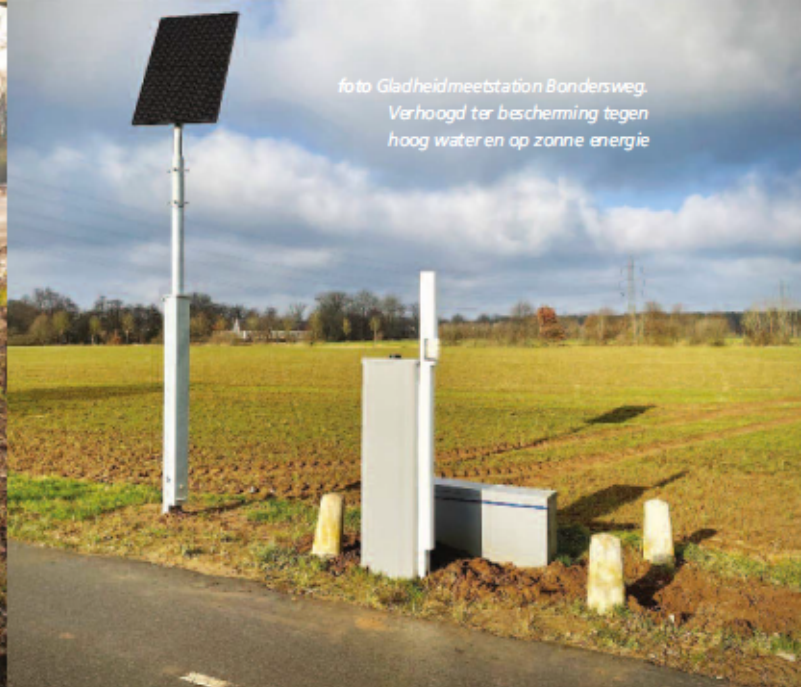
foto Gladheidmeetstation Bondersweg. Verhoogd ter bescherming tegen hoog water en op zonne energie