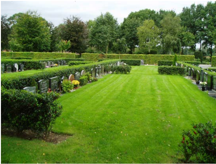
Figuur 1.2 Het leggen van nieuwe graszoden geeft een mooi resultaat, frequentie verhogen?