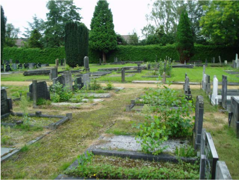
Figuur 1.4 Door tussenpaden en graven mee te nemen in een nieuw bestek zal het beeld aanmerkelijk verbeteren.