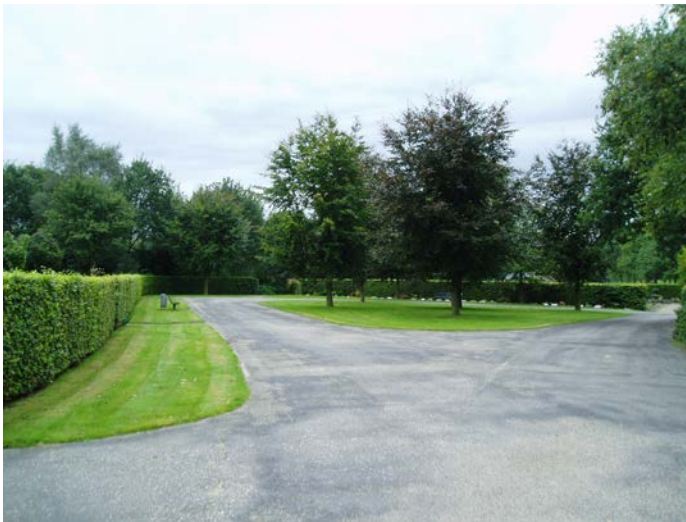
Figuur 1.1 Begraafplaats Lambalgen heeft een hoog onderhoudsniveau.

Het onderhoud van begraafplaats Lambalgen wordt conform het huidige bestek uitgevoerd en levert weinig problemen op. Gemeente Scherpenzeel is tevreden over het huidige onderhoudsniveau. Toch zijn er nog enkele knelpunten die in een nieuw te formuleren bestek opgelost moeten worden.