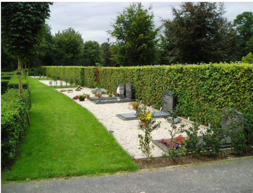
Figuur 2.1 Verzorgder beeld en lagere onderhoudskosten

In 2007 is begonnen met het aanbrengen van grindvakken. Hierop wordt begraven met liggende stenen. Het afgelopen jaar is gebleken dat hier grote belangstelling voor is. Gemeente Scherpenzeel zal conform het collegebesluit van 18 september 2007 doorgaan met het aanleggen van grindvakken. De grindvakken zijn bij het inzakken van de graven veel makkelijker te herstellen. Bijkomend voordeel is dat de vakken goedkoper zijn in het beheer.