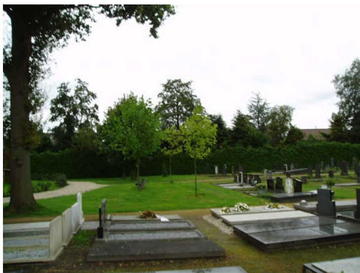
Figuur 2.2 Aanplant van bomen zal het parkachtige karakter van Glashorst versterken

Op begraafplaats Glashorst vindt sporadisch nog een bijzetting plaats. De locatie van de begraafplaats heeft uiteraard de bestemming 'begraafplaats'. Door de ligging midden in de bebouwde kom krijgt begraafplaats Glashorst steeds meer een parkachtige en ecologische functie. Het beheer is er dan ook op gericht om belangrijke groenelementen zoals solitaire bomen de ruimte te geven.