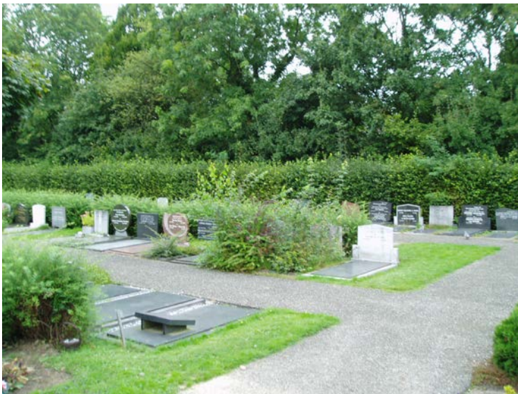
Figuur 1.3 Overwoekerd graf, hier wordt (of kan) geen onderhoud gepleegd (worden) door nabestaanden.

Ook het onderhoud van begraafplaats Glashorst wordt conform bestek uitgevoerd. Het beeld van begraafplaats Glashorst is minder goed verzorgd dan begraafplaats Lambalgen. Over het toekomstig onderhoud van Glashorst dienen duidelijke keuzes gemaakt te worden.