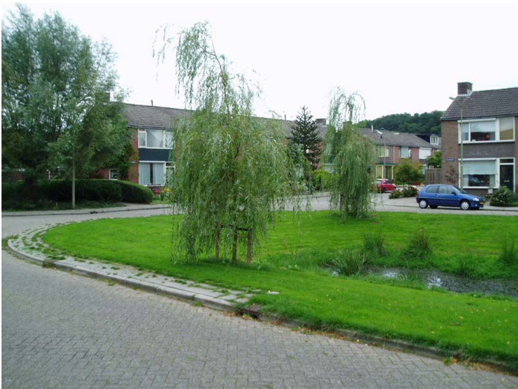
Figuur 2.2 Bomen in gazon (i.p.v. sierheesters tot aan de waterkant) is efficiënt in beheer en geeft een verzorgd beeld.

Toekomstige (kleinschalige) renovatieprojecten bieden een kans om over te gaan naar een efficiënter te beheren groentype. In Scherpenzeel vinden we nog diverse locaties waarbij er sierheesters (bijvoorbeeld rozen en spiraea) tot aan de waterkant zijn gesitueerd. Gazon met bomen is efficiënter en dus goedkoper te beheren. Het plantsoen rondom de vijver aan de Parklaan / Molenweg is één van de mogelijke locaties om dit uit te voeren.