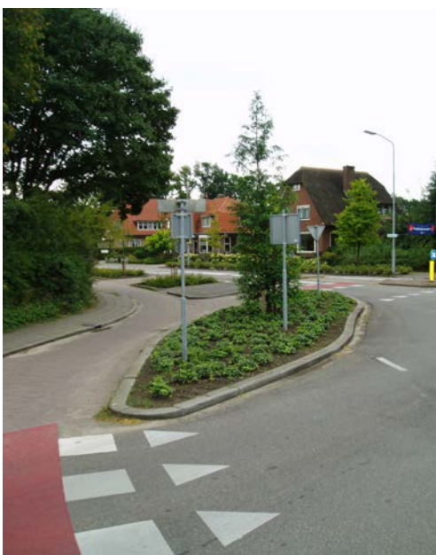
Figuur 2.3. A-kwaliteit onkruidbeheer geeft mooie beplanting de ruimte.

Nu het grote omvormingsplan is uitgevoerd is het van essentieel belang dat jaarlijks in het najaar enkele plantsoenen gerenoveerd worden om de algehele kwaliteit van het plantsoen te versterken. Dit is noodzakelijk om in een structurele beheercyclus te komen. Conform afspraak worden jaarlijks de meest slechte plantsoenen gerenoveerd. Dit najaar worden deze renovatiewerkzaamheden gecombineerd met de inboet.