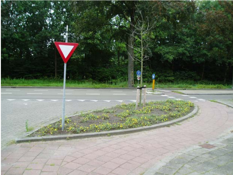
Figuur 2.2 Niet alle nieuwe aanplant is goed aangeslagen (aangeplant in het voorjaar), inboet is hier nodig

Aanplant in het najaar zorgt voor minder uitval en een beter hergroei. Hierdoor worden de kosten van de inboet gedrukt en zal door de snellere sluiting van de beplanting de onkruiddruk verminderen.