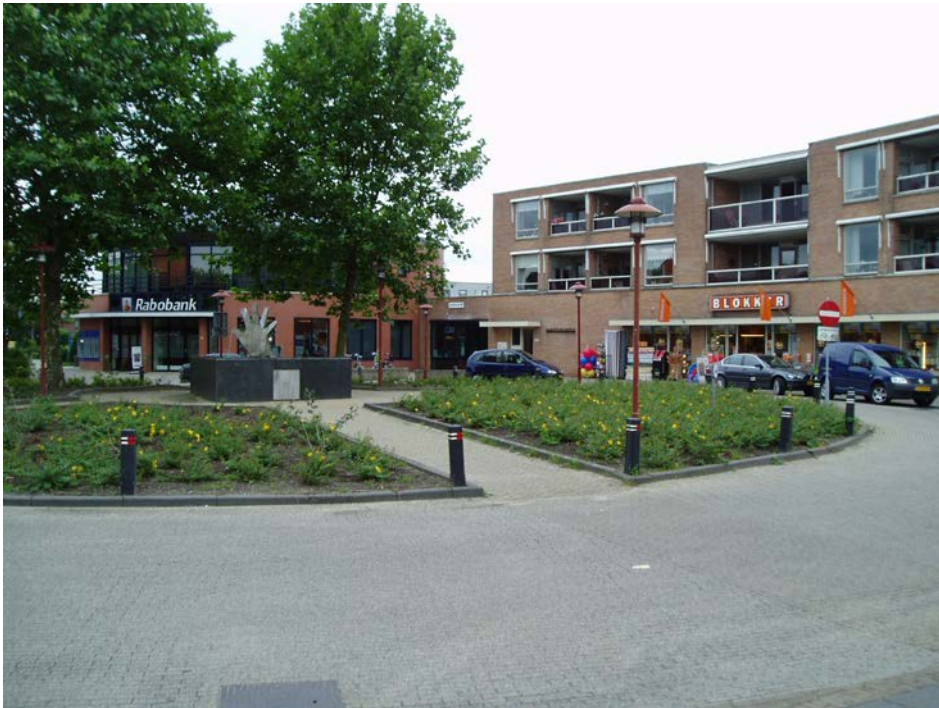
Figuur 2.1 Nog één groeiseizoen om volledige bodembedekking te realiseren

Het afgelopen jaar is het omvormingsplan welke in de gemeenteraad van 5 juli 2007 is vastgesteld uitgevoerd. Een groot deel van de nieuwe aanplant heeft het eerste en moeilijkste jaar goed doorstaan en zal zich de komende jaren verder gaan ontwikkelen en tot sluiting komen.