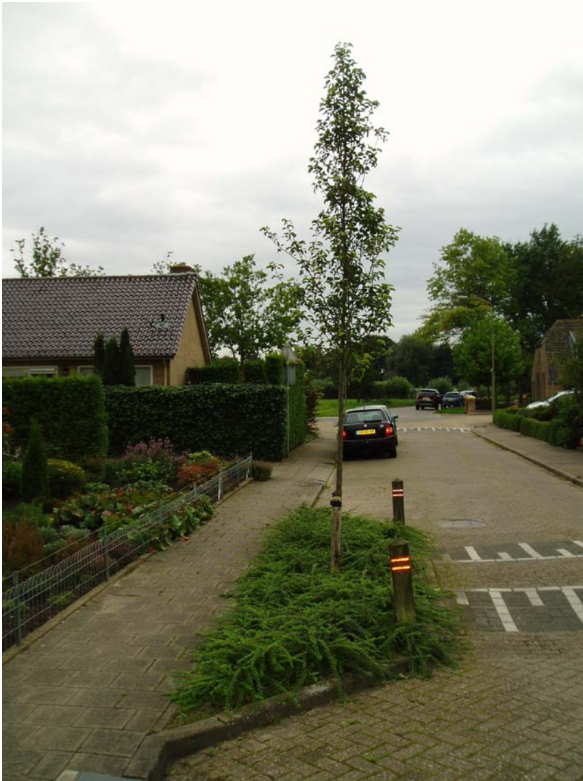
Figuur 2.3 Het onderhoudsvriendelijk groeistadium is hier al in één jaar bereikt

Intensief onkruidbeheer zorgt voor een snelle en goede sluiting van de beplanting zonder ongewenste wortelstokvermeerderende onkruiden die vaak terugkeren.