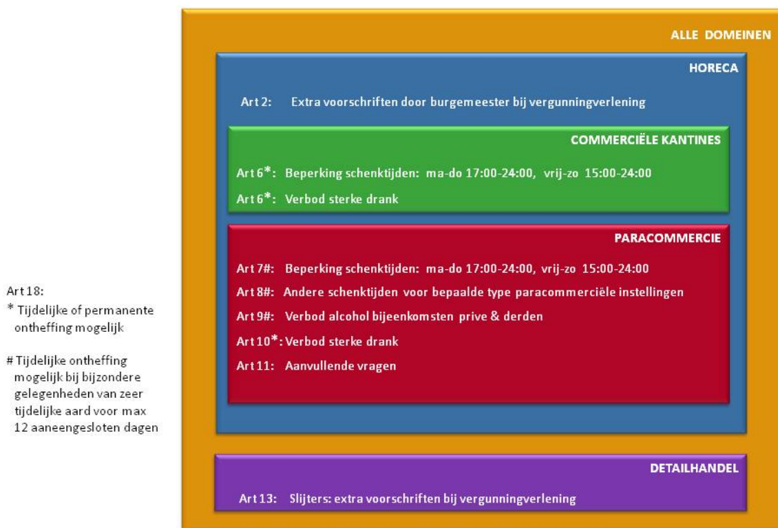
Figuur 1: Hoofdelementen FrisValley modelverordening

In deze modelverordening worden sommige artikelen uit de landelijke modelverordening van STAP niet gebruikt. Ze zijn echter wel opgenomen, maar met allen het artikelnummer, titel en de melding “GERESERVEERD”. Dit is gedaan om in de toekomst deze artikelen mogelijk wel te kunnen inzetten, al of niet in 1 of meer gemeenten in de regio. Ook kan het zijn dat in de toekomst besloten wordt artikelen niet meer te gebruiken. Door deze werkwijze kan de opbouw en nummering in de hele regio intact blijven en kunnen eventuele updates van het landelijke model in de toekomst makkelijk worden verwerkt.