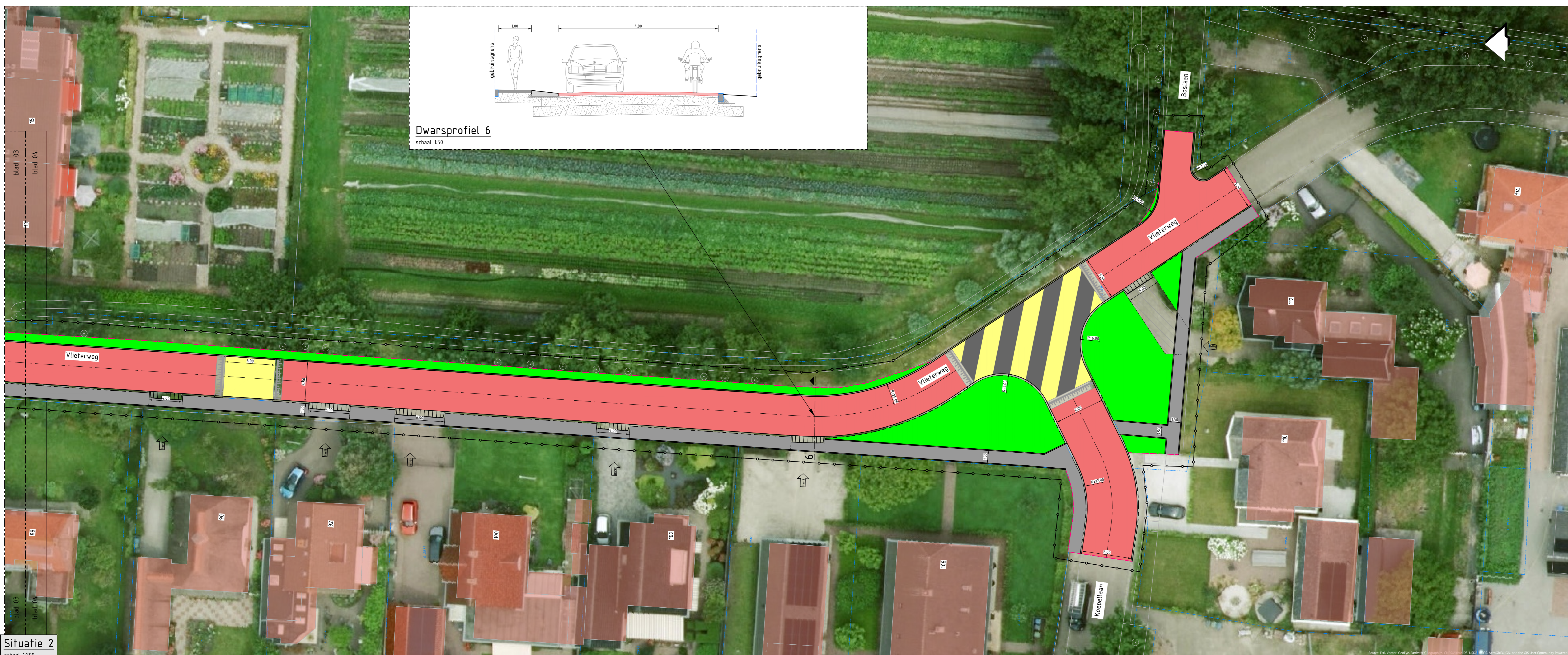
Situatie 2 schaal 1:200