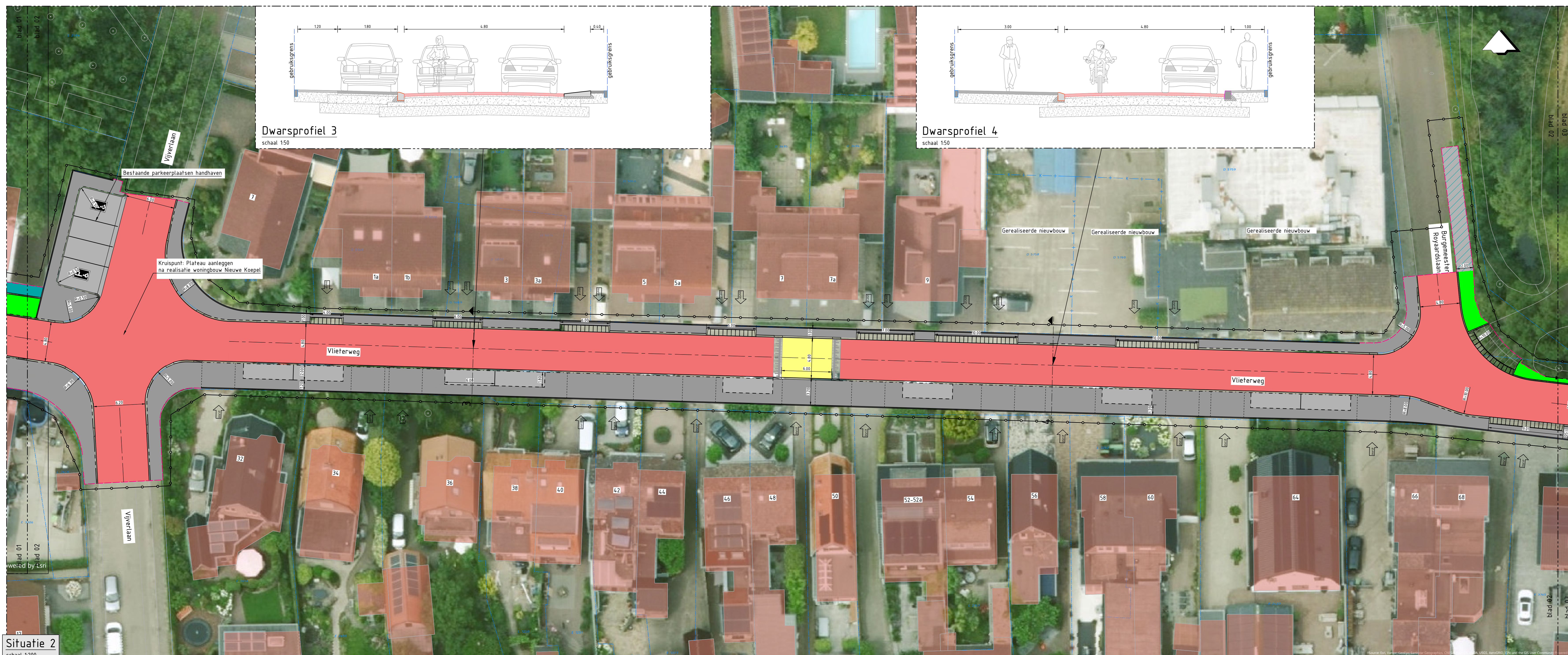
Situatie 2 schaal 1:200