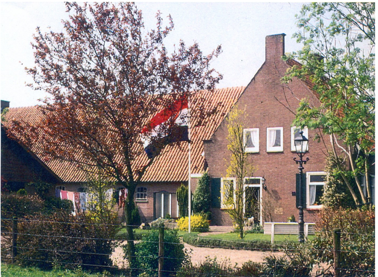
Boerderij "De Pol" , Brinkkanterweg 39