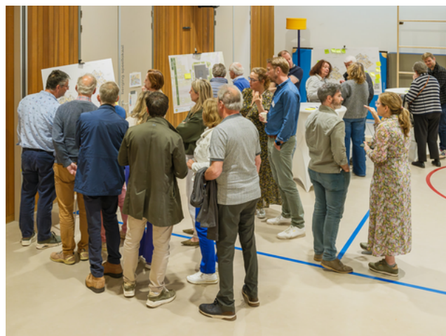
Belangstellenden stellen vragen en geven hun reactie op de panelen van de architect.