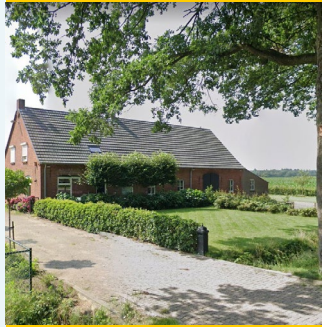
landelijk en agrarisch