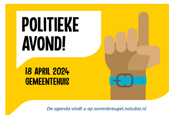
De agenda vindt u op sonenbreugel.notubiz.nl

Tijdens deze Politieke Avond komen de volgende onderwerpen aan bod: