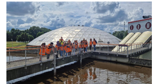
De JGR op excursie bij waterschap De Dommel

Op donderdag 20 juni 2024 vergadert de jeugdgemeenteraad (JGR). De vergadering begint om 16.00 uur en vindt plaats in de Raadzaal in het gemeentehuis.