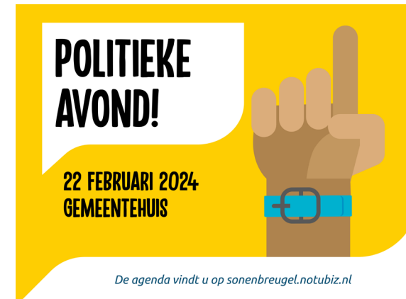
De agenda vindt u op sonenbreugel.notubiz.nl

Tijdens deze Politieke Avond komen de volgende onderwerpen aan bod: