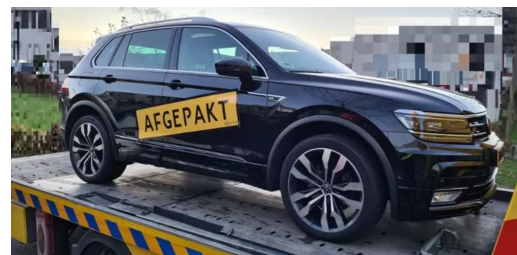
▲ De dure auto werd afgepakt bij een huiszoeking in Son en Breugel.

Een nieuwe ontwikkeling bij de aanpak van witwassen is de toepassing van het zogeheten zes stappen-arrest witwassen. Dit betekent dat er wel sprake is van witwassen (onverklaarbaar vermogen) maar dat het nog niet duidelijk is op welk gebied. Verdachte dient aan te geven hoe hij/zij over het vermogen kan beschikken. Normaal gezien start een witwasonderzoek pas als er sprake is van een duidelijk gronddelict (bijvoorbeeld exploitatie van hennep).