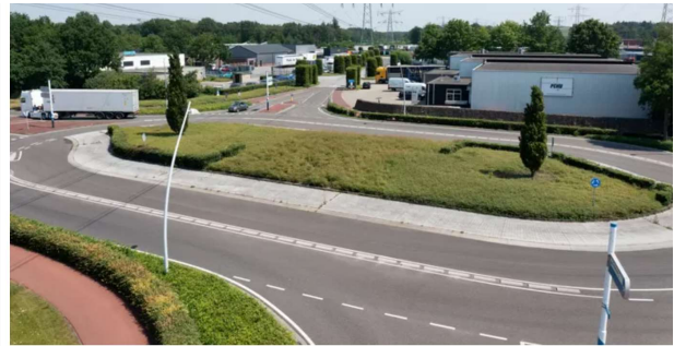
▲ Industrierrein Eeneind in Nuenen.

Door het handhavingsknelpunt is meer zicht ontstaan op de handel en wandel van de autobranche op Eeneind. De gemeente Nuenen heeft een aantal maatregelen genomen om het ondernemingsklimaat van Eeneind te verbeteren, zoals cameratoezicht en een exploitatievergunningplicht. Door middel van o.a. structurele bestuurlijke controles, monitoring van het verloop van bedrijven (o.a. via KvK) en toepassen van BIBOB bij de exploitatievergunningen blijft de gemeente hieraan werken. Het Handhavingsknelpunt Konik is in februari 2022 afgesloten.