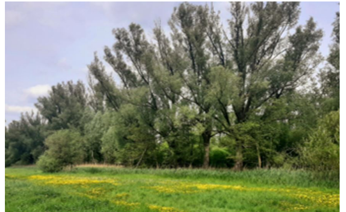
2. Kleine Dommel