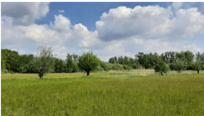
3. Urkhovense Zegge