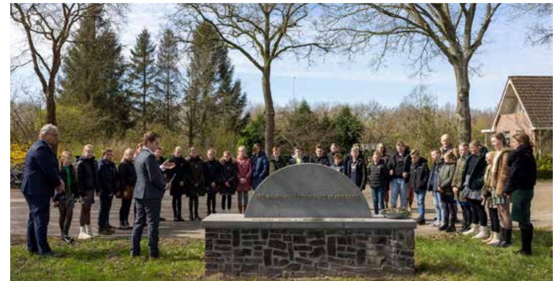
School herdenkt fusillade verzetsmensen bij oorlogsmonument