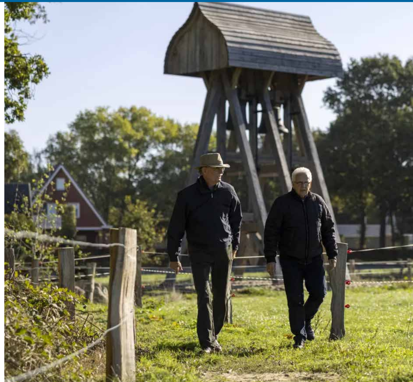
Klokkenstoel Olde Kerkhofsweg