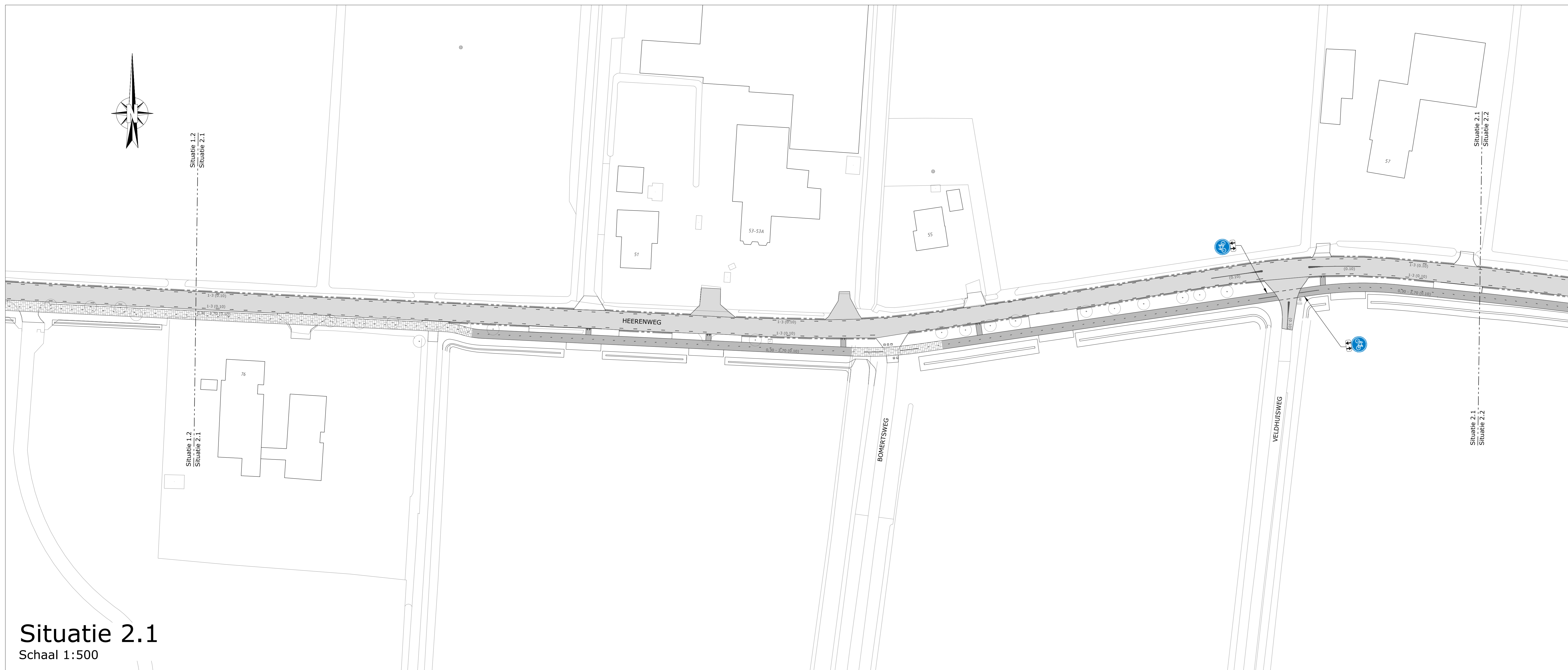
Situatie 2.1 Schaal 1:500