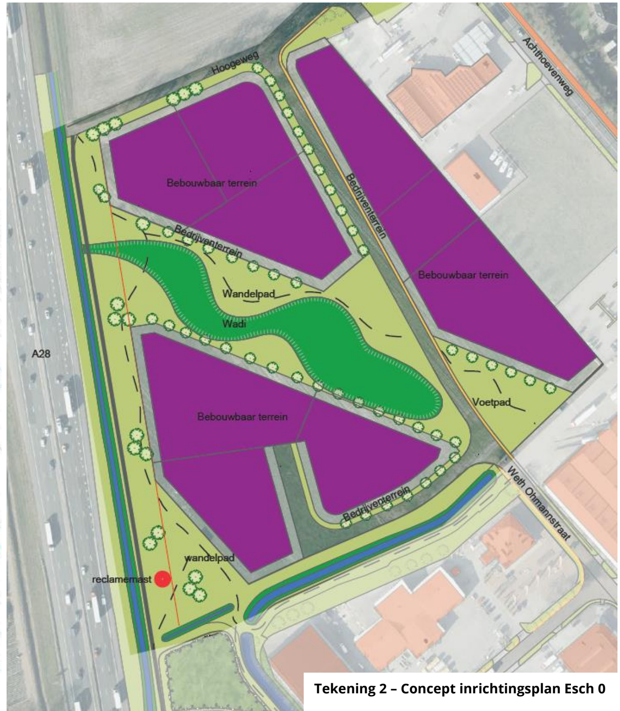
Tekening 2 - Concept inrichtingsplan Esch 0