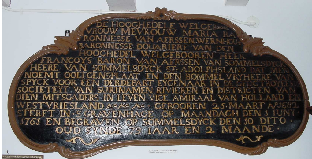
Rouwbord aanwezig in het Streekmuseum Goeree-Overflakkee te Sommeldijk

stellen. Tijdens een wandeling vóór zijn ambtswoning aan de Oranjelaan werd hij door muitende en half dronken soldaten belaagd. De hevig verontwaardigde en driftige Van Aerssen trok hierbij zijn degen om de muiters terug te jagen, waarna hij, na door 46 kogels te zijn doorboord, dood ter aarde viel! Er was namelijk onrust ontstaan onder de soldaten van het garnizoen in Paramaribo - door Van Aerssen meestal aangeduid als 'Droncken verckens' - omdat zij werden ingeschakeld bij het aanleggen van versterkingen bij Fort Zeelandia, werk dat normaal niet door de soldaten werd verricht, maar door slaven. Hij zag zich hiertoe echter genoodzaakt bij gebrek aan arbeidskrachten. Van Aerssen heeft voor Suriname veel betekend. In de vijf jaar van zijn bestuur werd de orde in de kolonie hersteld en ging men een welvarende toekomst tegemoet.