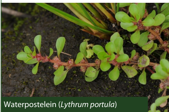
Waterpostelein ( Lythrum portula )