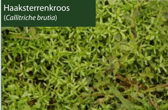
Haaksterrenkroos ( Callitriche brutia )

Sterrenkroos met een typische ingekeerde top, te zien met een loupe.