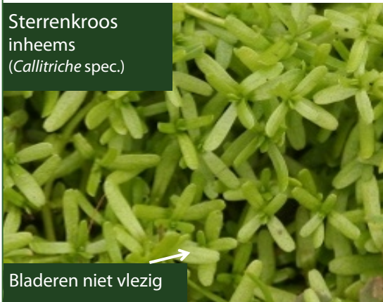
Sterrenkroos inheems ( Callitriche spec. )