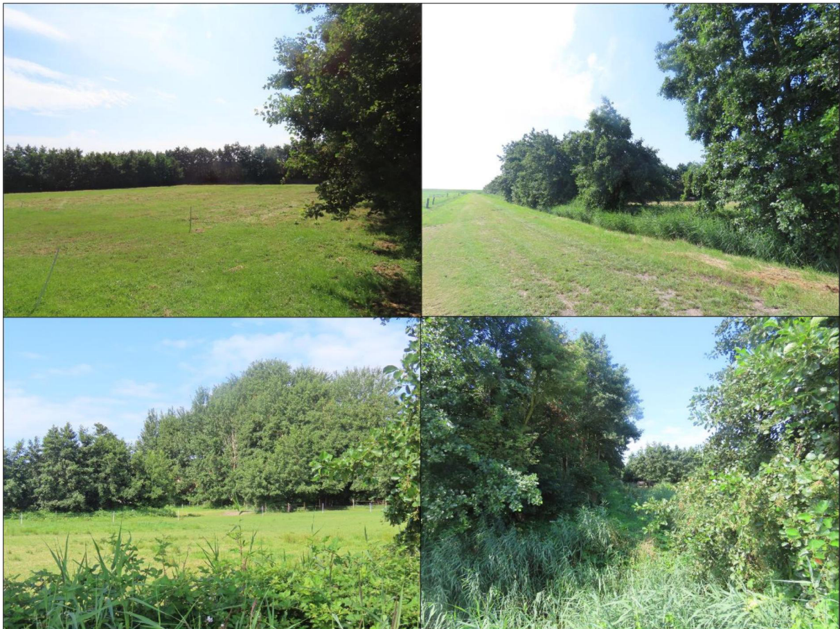
Figuur 1.2. Een impressie van het plangebied.

Het planvoornemen bestaat uit het realiseren van ca. 50 wooneenheden binnen het plangebied. De exacte invulling hiervan, zoals de opstelling van de wooneenheden, is nog niet concreet. Mogelijk worden sloten gedempt en/of bomen gekapt als onderdeel van het planvoornemen.