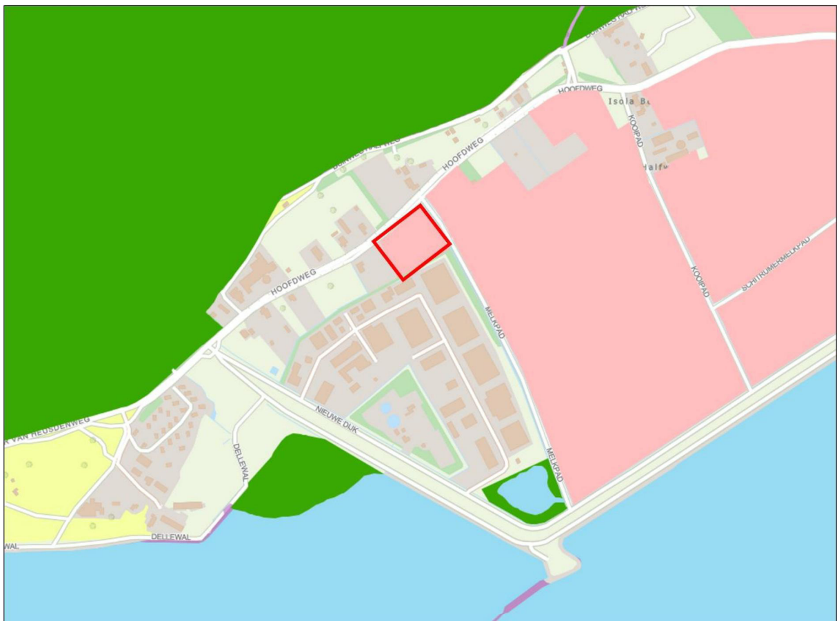
Figuur 2.3. Het plangebied (rood omlind) is aangewezen als NNN Beheergebied (roze vlakken).

Het plangebied is opgenomen in het NatuurNetwerk Nederland (NNN) als NNN beheergebied (figuur 2.3). Als gevolg van het planvoornemen gaat een deel van dit NNN beheergebied verloren. Negatieve effecten op de NNN als gevolg van het planvoornemen kunnen derhalve niet op voorhand worden uitgesloten.