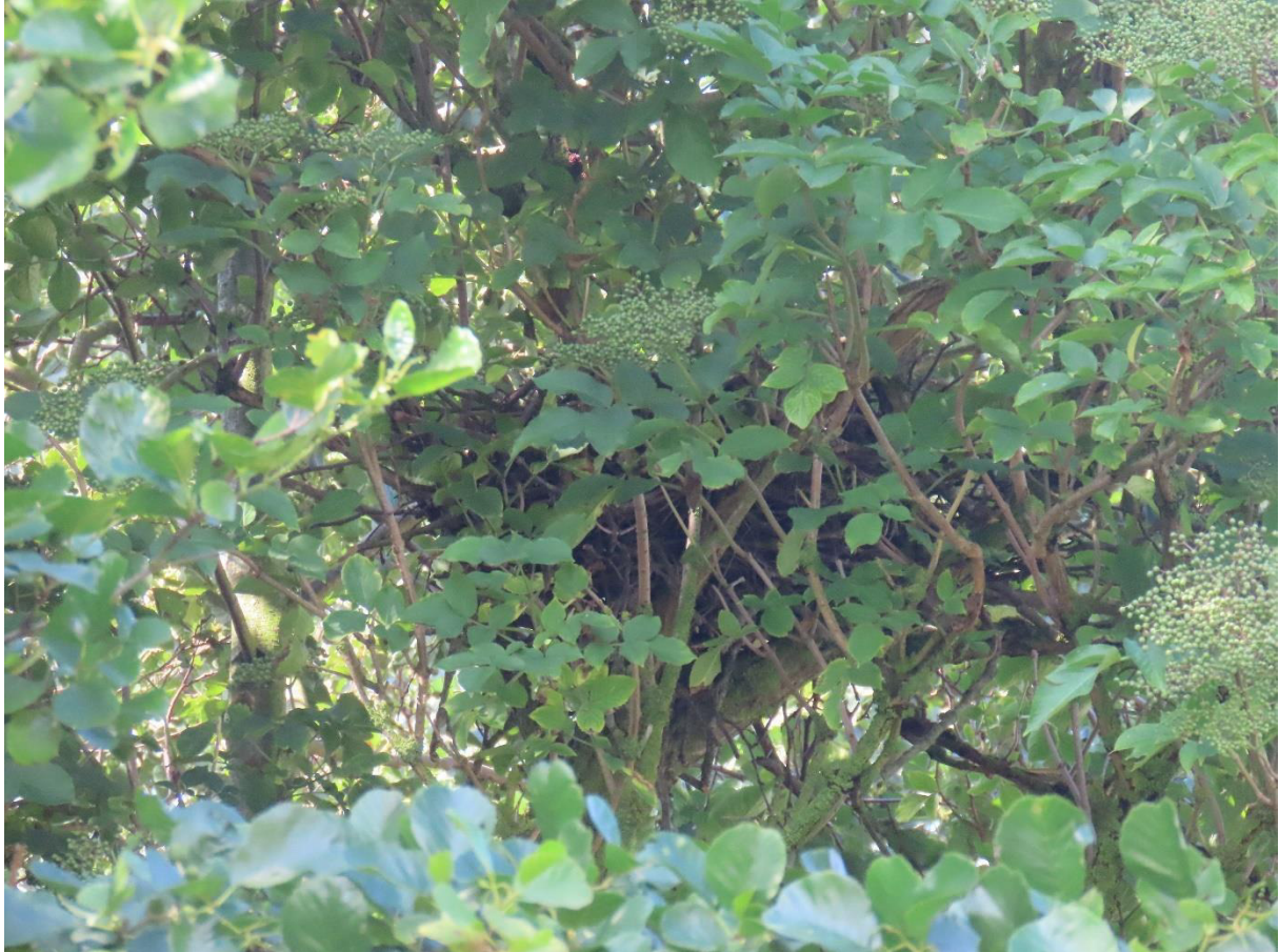
Figuur 2.1. Een boomnest vlak buiten het plangebied.

Gelet op de goed verdekte locatie van het nest kan naar ons inzicht niet op voorhand worden uitgesloten dat dit een nestlocatie van een soort als buizerd, sperwer, ransuil of boomvalk betreft. Hoewel de boom waarin dit nest zich bevindt binnen het planvoornemen niet wordt aangetast, kunnen de werkzaamheden wel gepaard gaan met negatieve effecten op dit nest. Negatieve effecten op een eventueel jaarrond beschermd boomnest als gevolg van het planvoornemen kunnen niet op voorhand worden uitgesloten.