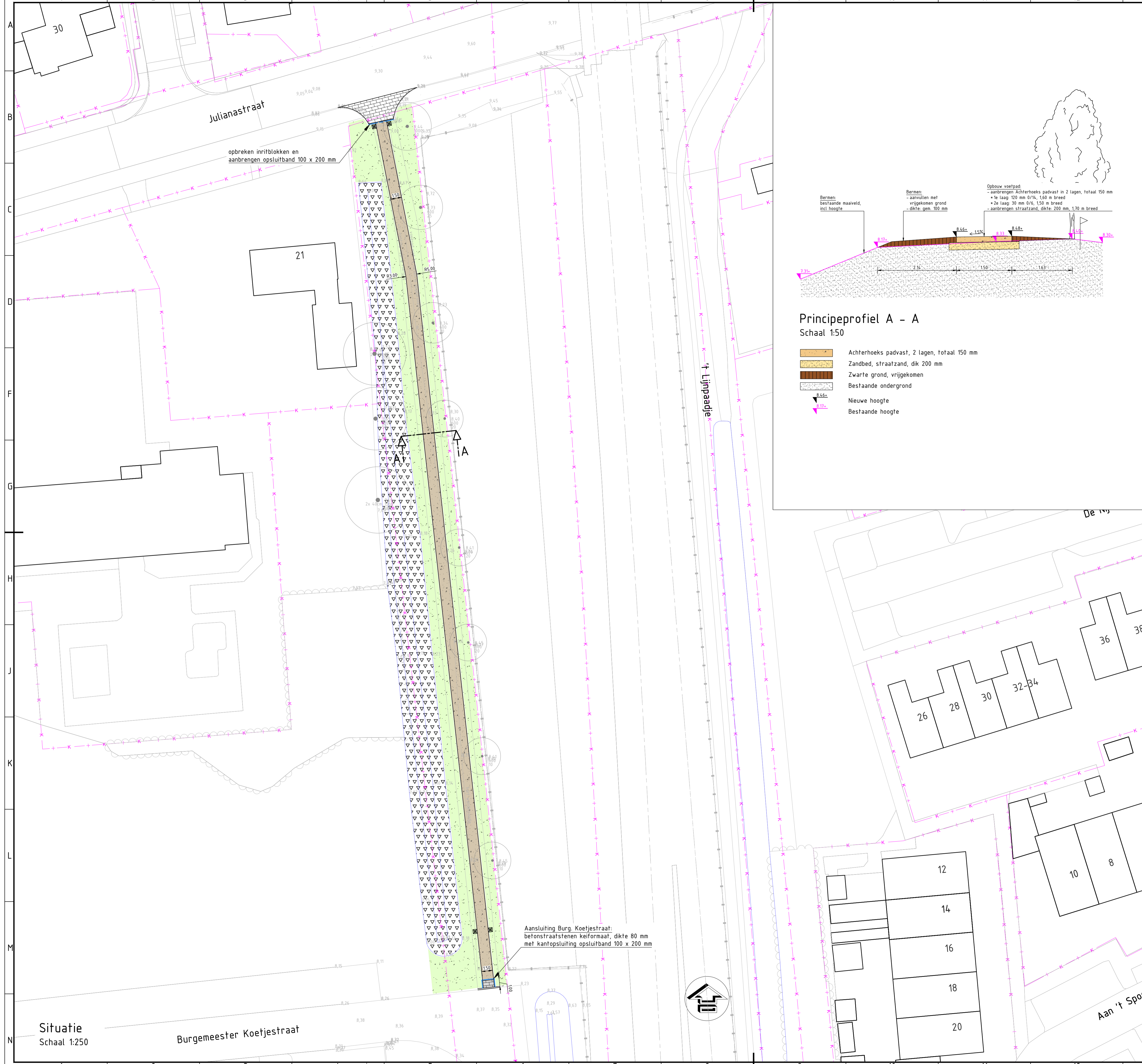
Principeprofiel A - A Schaal 1:50