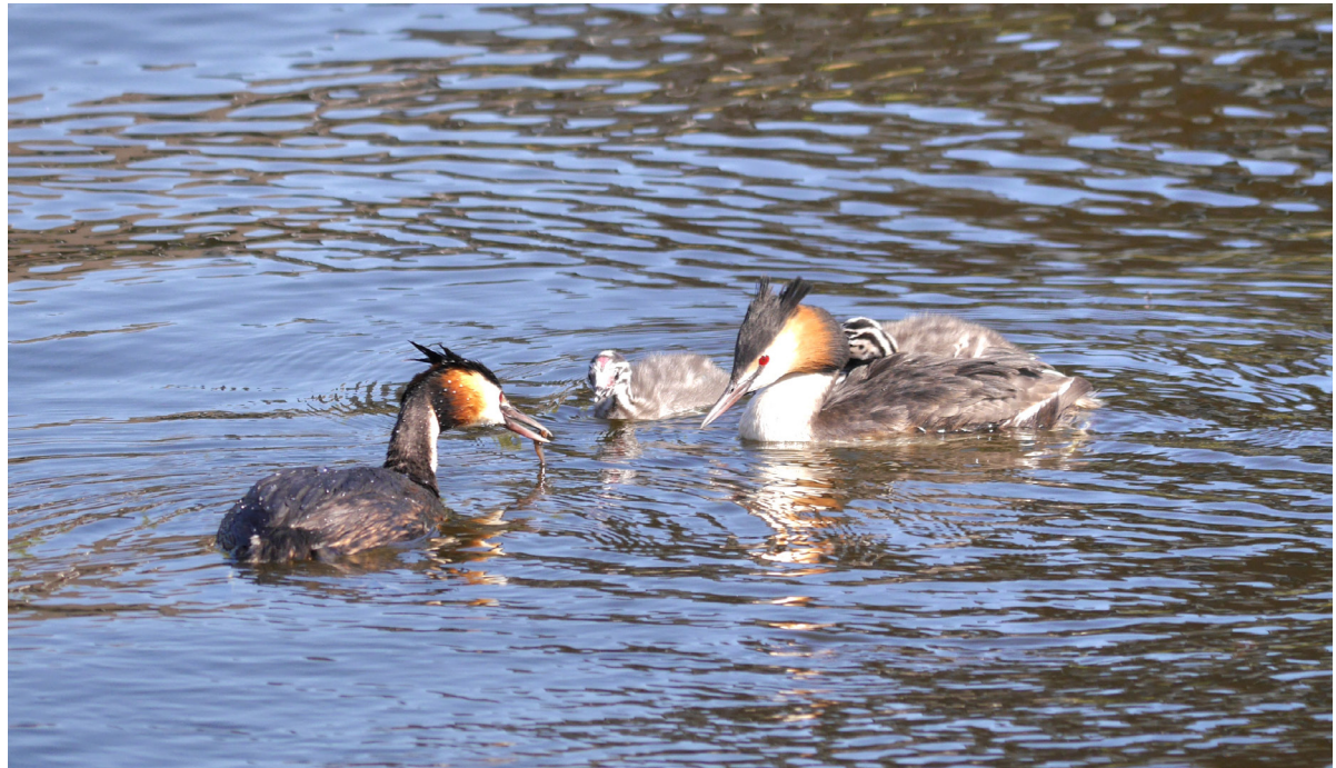
Voedertijd voor de fuutkuikens in Vroomshoop

Elke week een foto die gemaakt is in onze gemeente. Heeft u een mooie foto voor deze rubriek? Mail die naar ons via communicatie@twenterand.nl .