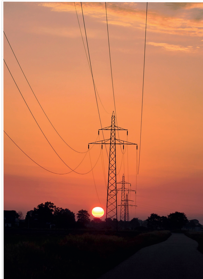
Zonsondergang bij de zandwinning

Elke week een foto die gemaakt is in onze gemeente. Heeft u een mooie foto voor deze rubriek? Mail die naar ons via communicatie@twenterand.nl of deel ze via social media met #ditisTwenterand