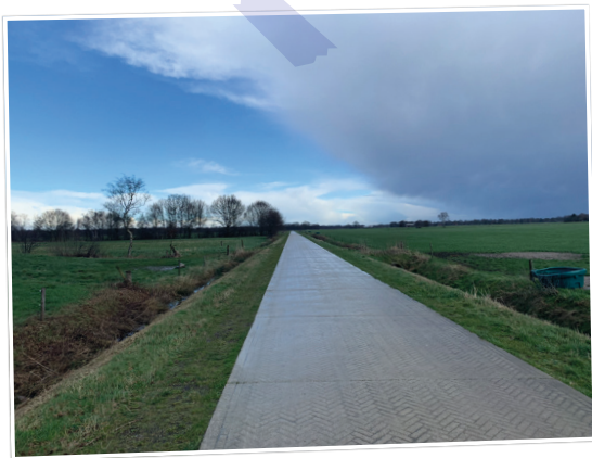
Donkere wolken naast heldere lucht Veeneindeweg ■

Elke week een foto die gemaakt is in onze gemeente. Hebt u een mooie foto voor deze rubriek? Mail die naar: communicatie@twenterand.nl .