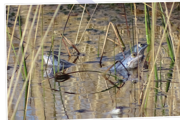
Het mannetje van de blauwe heikikker in Engbertsdijksvenen - Ineke de Leeuw ■

Elke week een foto die gemaakt is in onze gemeente. Hebt u een mooie foto voor deze rubriek? Mail die naar: communicatie@twenterand.nl .