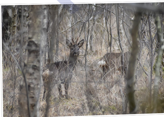
Reeën in de Engbertsdijkvenen - Bertine Brill ■

Elke week een foto die gemaakt is in onze gemeente. Hebt u een mooie foto voor deze rubriek? Mail die naar: communicatie@twenterand.nl .