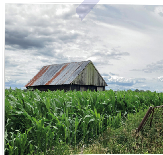
Schuurtje verdwijnt in de mais aan de Veeneindeweg - Gina Olthof. ■

Elke week een foto die gemaakt is in onze gemeente. Hebt u een mooie foto voor deze rubriek? Mail die naar: communicatie@twenterand.nl .