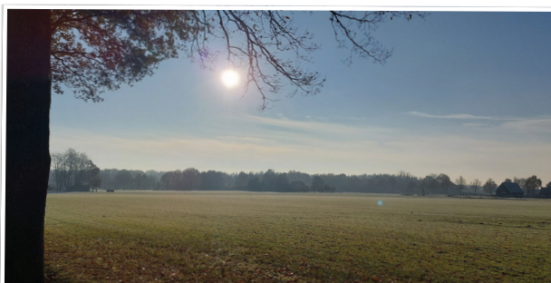
Blik over de velden vanaf de Russenweg op de grens van Den Ham en Vroomshoop - Henk de Vries ■

Elke week een foto die gemaakt is in onze gemeente. Hebt u een mooie foto voor deze rubriek? Mail die naar: communicatie@twenterand.nl .