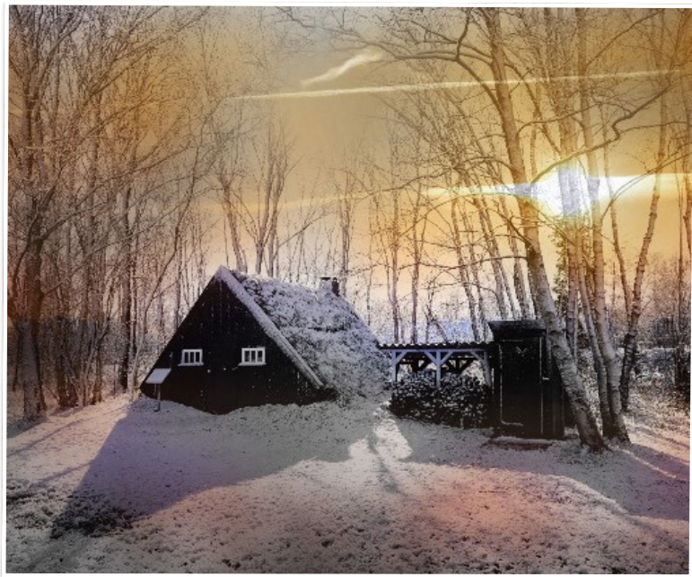
Winterlandschap in Twenterand

Hebt u een mooie foto voor deze rubriek? Mail die naar: communicatie@twenterand.nl .