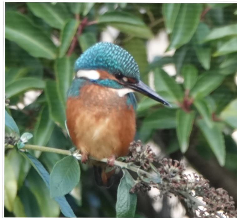
IJsvogeltje in eigen tuin in Den Ham

Elke week een foto die gemaakt is in onze gemeente. Hebt u een mooie foto voor deze rubriek? Mail die naar: communicatie@twenterand.nl .