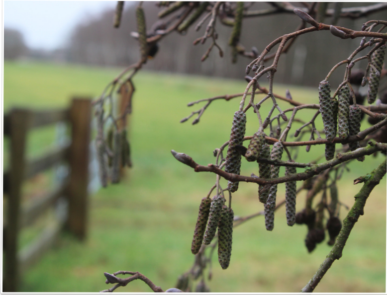
Mooi plaatje langs de Tonnendijk.

Elke week een foto die gemaakt is in onze gemeente. Hebt u een mooie foto voor deze rubriek? Mail die naar: communicatie@twenterand.nl .